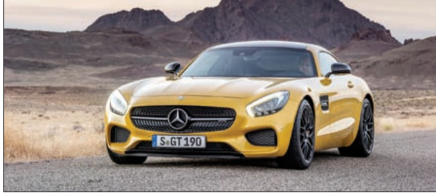
مرسيدس GT S