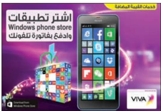
خدمات القيمة المضافة

ويهدد المبادرة الفريدة، يستطيع عملاء VIVA شراء التطبيقات من Windows Store دون الحاجة لبطاقة ائتمانية، وذلك من خلال احتساب التكاليف مباشرة على فاتورة الدفع الأجل أو خصمها من حساب مسبق الدفع. حالياً يمكن للعملاء الاستفادة من هذه الخدمة الجديدة ويأتي هذا الاتفاق دليلاً على الشراكة الاستراتيجية بين VIVA، Microsoft ومنتججرات الشركة الرائدة في الشرق الأوسط. إن استخدام تطبيقات الأجهزة الذكية سبب طفرة في عالم بيئة مريحة و ملائمة، وإلتزام التحويولات الخاصة بالعملاء بطريقة دفع سهلة أخرى