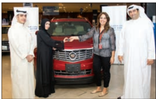
فريق بنك الخليج يسلم مفاتيح السيارة للفائزة

واقام السحب كجزء من فعاليات سحب بنك الخليج الربع السنوي 3 في 1، يوم الخميس الموافق 25 يونيو 2015 في مجمع الأفتيون بحضور وإشراف ممثل وزارة التجارة والصناعة. ويتيح حساب red