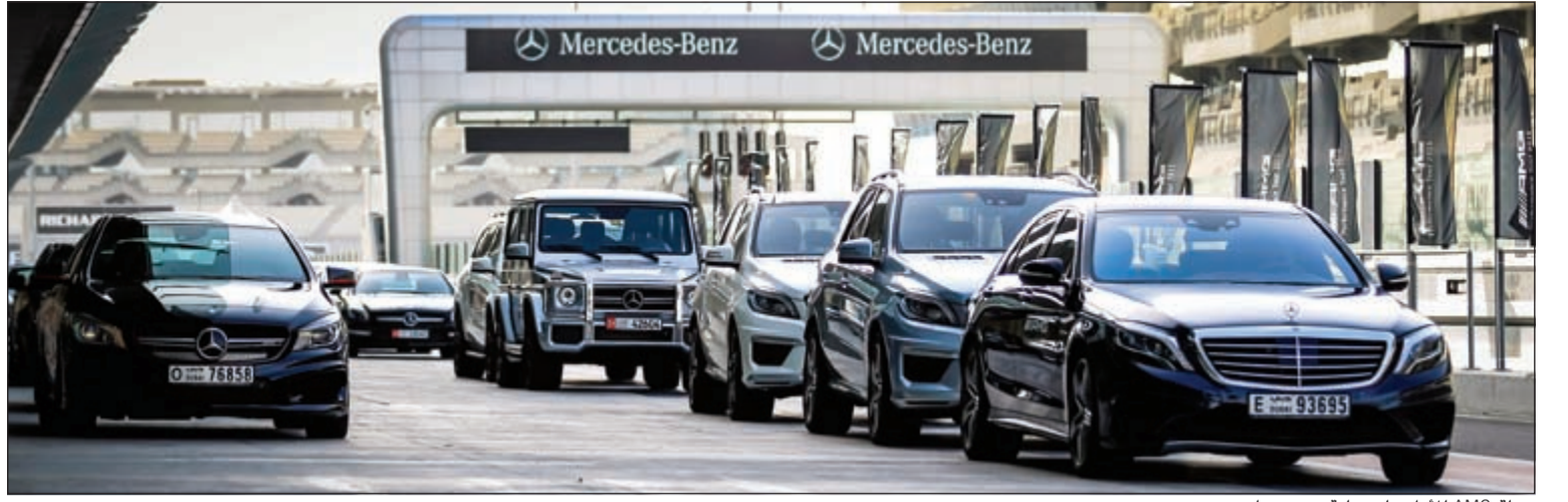
جولة AMG للاداء على حلبة مرسى ياس

خلال حفل توزيع جوائز «عالم الفخامة العربية» للعلاقات العامة 2015