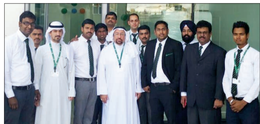
فريق عمل «الملا العالمية للصيرفة» خلال افتتاح فرع الشويخ الصناعية

تضمها. وأضاف جوشي أن الشركة على استعداد لتقديم كل خدماتها ومنتجاتها للعملاء، وسط ارتباط اسمها بأفضل المؤسسات المالية العالمية، مشيراً إلى أن افتتاح الفرع الجديد يعكس مساعيها في تنفيذ سلسلة من المبادرات والبرامج الاستراتيجية التي تشمل على توسيع الفروع، وطرح خدمات متطورة لشرائح مختلفة من المجتمع، في إطار سياسة الاقتراب أكثر من العملاء في كل أرجاء الدولة، إذ إن الهدف الرئيسي وراء عملية التوسع إطلاق خدمات الشركة بشكل مبتكر وجذاب، وشدد جوشي على التزام الشركة من خلال فرعها الجديدة تجاه عملائها، ومساعيها نحو تلبية الطلب على خدمات التحويلات المالية، مبيناً أنه تم تصميم الفرع وفقاً لأعلى المعايير وضمن بيئة مريحة وملائمة، وإلتزام التحويولات الخاصة بالعملاء بسرعة وأمان.