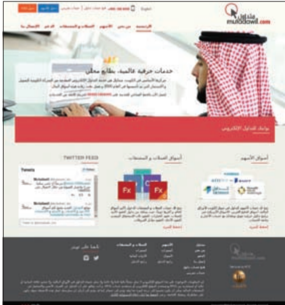
موقع متداول الجديد

أعلنت الشركة الكويتية للتأمين والاستثمار (كفيك) عن طرحها لموقع متداول الجديد والمتطور. وهذه الخطوة تعكس بشكل واضح وجلي التزام الشركة بمواكبة أحدث التطورات التكنولوجية. ومن الجدير بالذكر أن الموقع الجديد يحاكي المستهلكين بطريقة جذابة وعصرية، حيث تم تصميم الموقع ليكون أكثر تركيزاً على احتياجات المستخدمين النهائيين. وتم تطوير التصميم الجديد للموقع بمهنية عالية، وبطريقة تفاعلية واتقان هندسي. وذلك لإبراز الموقع بصورة تتناسب مع خدمة متداول، والتي تتميز بالحضور القوي في السوق، والباع الطويل في مجال التداول الإلكتروني.