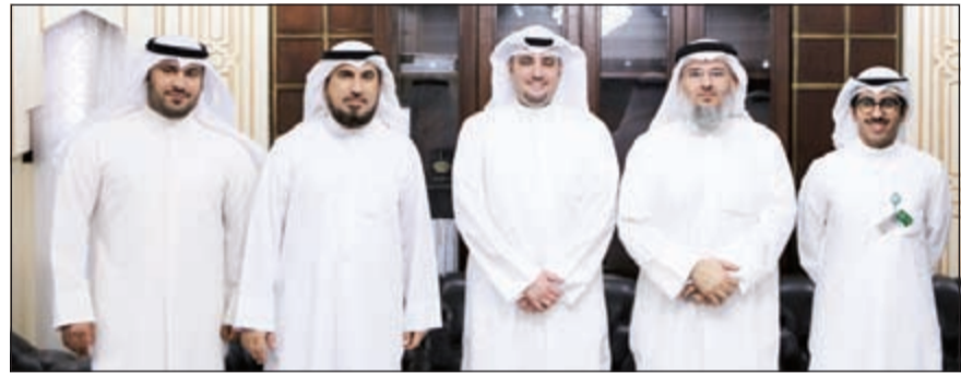
وقد متطوعي «بيتك» مع مسؤولي المسجد الكبير

أهدى بيت التمويل الكويتي (بيتك) المسجد الكبير 20 كرسيًا من الكراسي المتحركة بمناسبة العشر الأواخر من شهر رمضان المبارك، حتى تكون أداة مساعدة في تسهيل دخول المعاقين وغير القادرين خاصة من كبار السن والسيدات، تمكنهم من أداء الصلوات براحة ودون مشقة أو أي تأخير على المصلين الآخرين.