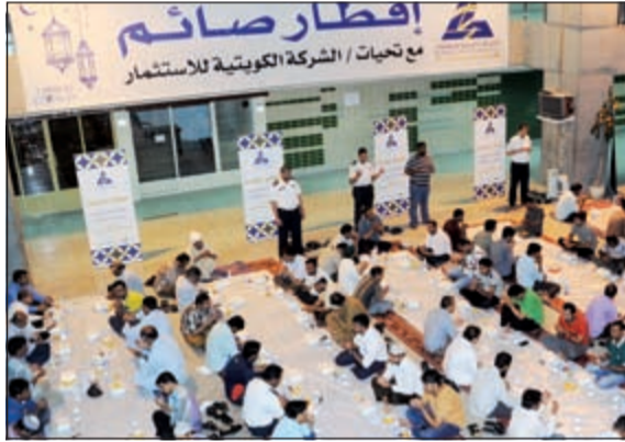
مائدة افطار صائم

كشفت الشركة الكويتية للاستثمار عن قيامها بإطلاق حملة مبادراتها الاجتماعية والإنسانية طوال شهر رمضان الكريم بعدد من الأنشطة والفعاليات التي تقدمها كعادتها في كل عام. وأكدت الشركة في بيان صحافي التزامها المستمر على مدار العام بمسؤوليتها الاجتماعية بما يتناسب مع ريادةها في مجال المبادرات الإنسانية، حيث تواصل تنظيم برنامج «مائدة افطار صائم» في مقرها بسوق المناخ للعام الثالث على التوالي من خلال تقديم عشرات الوجبات على الصائمين يومياً حتى نهاية الشهر الفضيل. كما تواصل الكويتية للاستثمار تقديم برنامج الترويج «وجبات السحور» على المصلين بمسجد الدولة الكبير