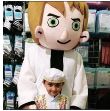
شخصيات كرتونية وملابس تراثية