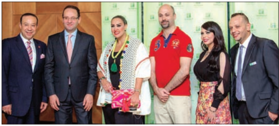
ترحيب بضيوف «هوليداي إن» السالمية