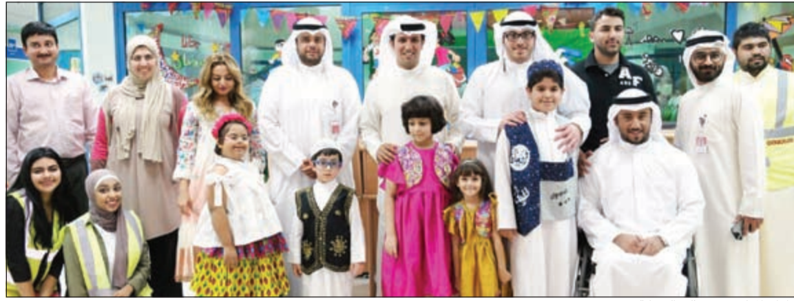
أطفال المركز مع ممثلي الشركة

إلى المساعدات والدعم الذي قدمه المتطوعون في بنك الدم بعد الأحداث الأخيرة في البلاد. وتعليقا على ذلك، قال مدير المسؤولية الاجتماعية - التواصل الاجتماعي والرعيات - يوسف الشلال «لدينا العديد من الفعاليات والأنشطة هذا العام خاصة في شهر رمضان الكريم، ونحن نؤمن إيمانا كبيرا بأهمية العطاء والتشجيع عليه لذلك قمنا بإشراك موظفينا في هذه الفعالية. نحن فخورون بجميع موظفينا المشاركين في هذه المبادرة وفخورون كذلك بالمجاميع التطوعية الشبابية وفريق نعين ونعاون الذي شارك في هذه المبادرة». وأضاف الشلال أن فريق المسؤولية الاجتماعية في الشركة يقوم بالتعاون مع فريق نعين ونعاون التطوعي بالإشراف على عدة مبادرات