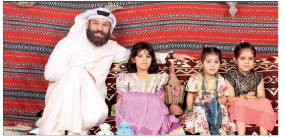
من أحد الاحتفالات بالقرقيعان

يأتي ضمن هذه النشاطات المستمرة لنهاية الشهر الفضيل. وأكد جواد ان مركز النصر الرياضي يدرك تماما أن المسؤولية الاجتماعية بالنسبة إليه هو أمر بالغ الأهمية، وتدرك أيضا ان مركز القرقيعان فرصة جيدة للتواصل مع الجمهور، وإثنا على يقين من ان هذه الاحتفالية تحمل معها معنى خاصا لدى الجميع لما تمثله للمجتمع الكويتي من أهمية كبيرة، مبينا أن هذا الحفل