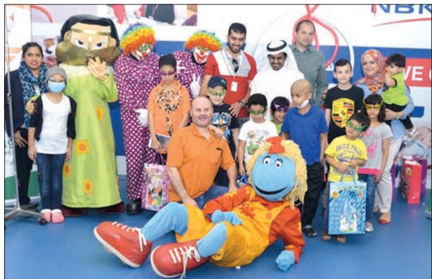
جانب من احتفال مركز سلطان بمستشفى الأطفال