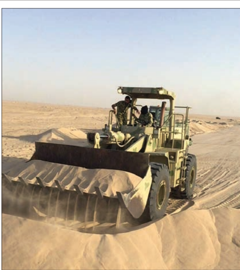
آليات الحرس الوطني خلال عملية إزالة الرمال من إحدى الطرق

بالتنسيق مع «الداخلية» والحرس الوطني و«نفط الخليج» «الأشغال» تزيل الكثبان الرملية من الطرق السريعة والداخلية 07