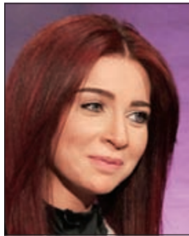
مي عز الدين

أشادت النجمة المصرية مي عز الدين بأغنية «المعلم» للفنان المغربي سعد المجرد، إذ وجهت مي تحية للمجرد عبر حسابها على «انستغرام»، فكتبت: «تحية كبيرة مني للنجم سعد المجرد، أحسنت السنة دي وتستاهل كل التكريم اللي اكرمته وكفي بشاشة وجهك، وأنا بعشيق أغنيته، أنت فعلاً «معلم»، تحية مني لكل شعب المغرب».