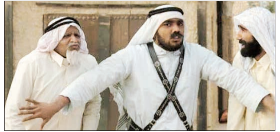
مشهد من مسلسل «بورعد2»