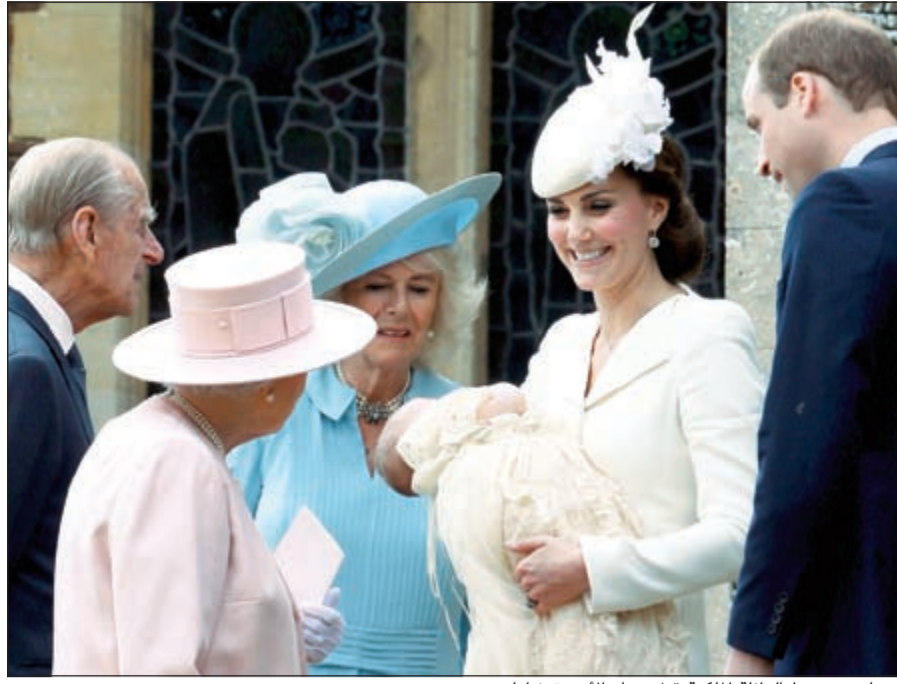
ميدلتون وسط العائلة الملكية قبل عماد الأميرة شارلوت