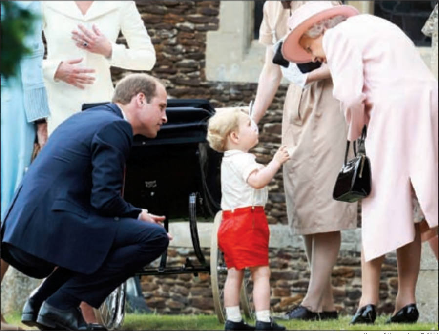
الملكة تداغب الأمير الصغير جورج