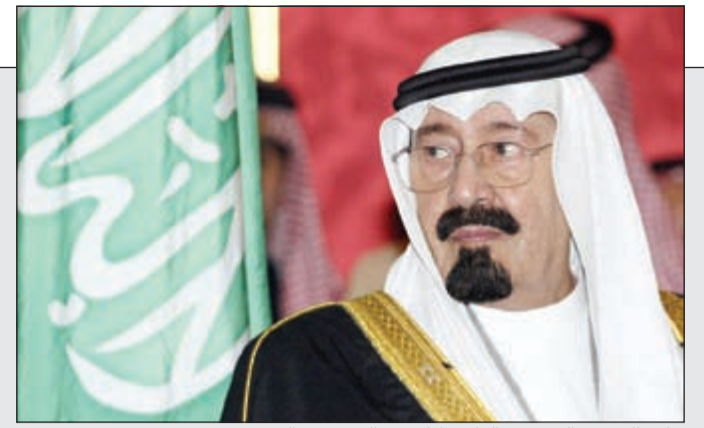
خادم الحرمين الشريفين الراحل الملك عبدالله بن عبدالعزيز

الملك عبدالله بن عبدالعزيز موصيا أبناءه: انشروا التسامح والسلام 44