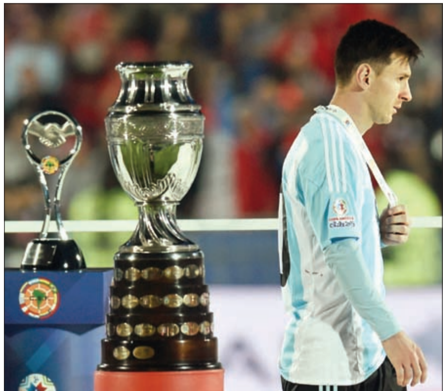
ميسي يفشل من جديد في تحقيق لقب قاري لمنتخب الأرجنتين