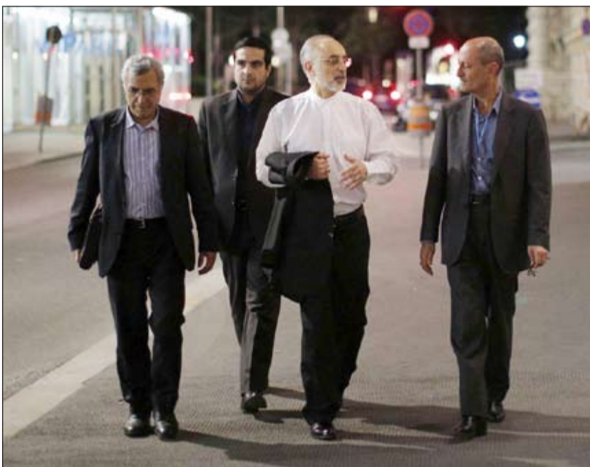
رئيس المنظمة الإيرانية للطاقة النووية علي صالحى وعدد من أعضاء الوفد المفاوض خلال تجولهم في أحد شوارع فيينا أمس حيث تجرى المفاوضات بين طهران و+5+1.

وأضاف «يجب عدم السماح لإيران بحيازة السلاح الأخطر في العالم ولاء خزانة الإرهاب»، مشيرا إلى أنه «كلما مر الوقت تزيد القوى الكبرى تنازلاتها لطهران».