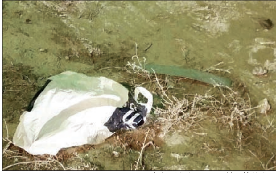
كيس القنابل أبلغ مواطن عن وجوده على الدائري السابع