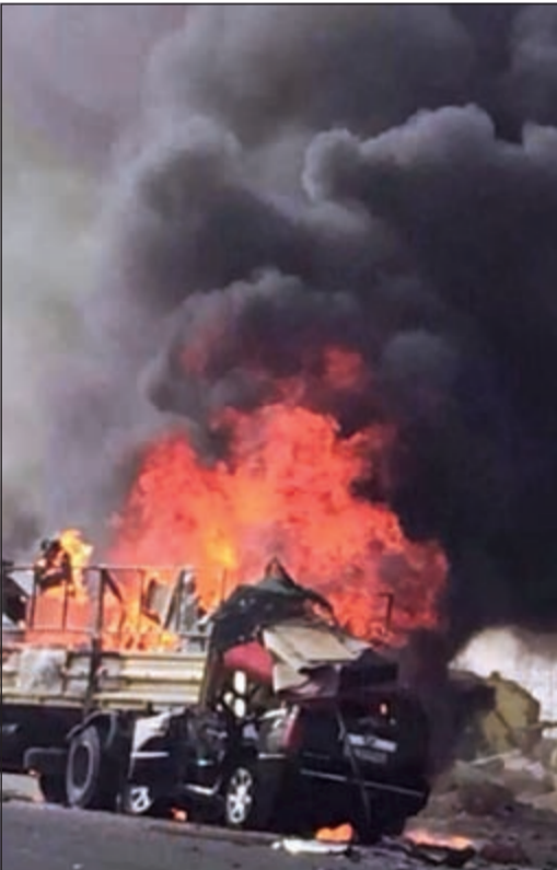
من حادث الدائري السابع