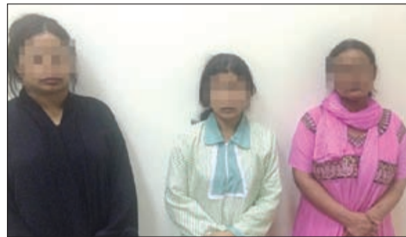
الوافدات الثلاث المتهمات بالنصب