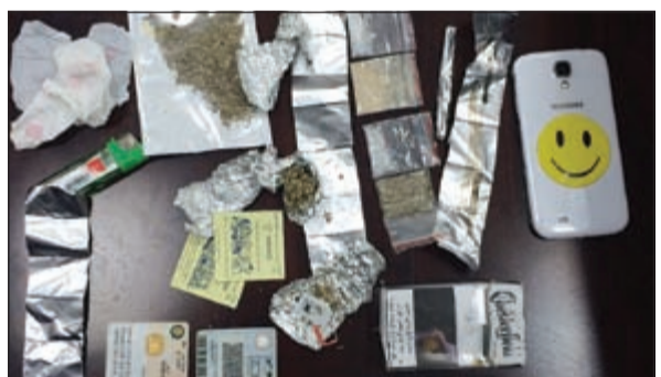
المخدرات المضبوطة مع الوافدين المصريين في حولي