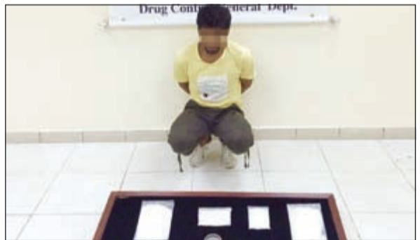
«البدون» تاجر المخدرات وأمامه الشبو والميزان الحساس