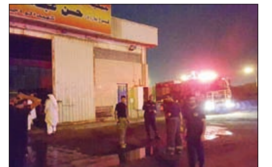
رجال الإطفاء عقب انقائهم من حريق فرع الغاز

اندلع حريق في فرع الغاز بمنطقة الرابية الا ان وصول رجال الإطفاء بسرعة كبيرة سهل إخماد النيران والسيطرة على الموقع الذي كاد يتسبب في كارثة لولا تدخلهم السريع.