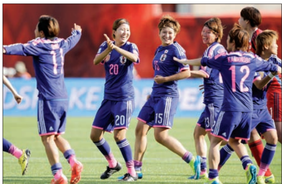
منتخب اليابان أمام فرصة تاريخية للاحتفاظ بلقب كأس العالم للسيدات

تخطت الولايات المتحدة، حاملة لقبها 1991 و1999، ألمانيا 2012. وسبق للولايات المتحدة ان حققت ثأرها من اليابان لخسارتها أمامها في نهائي نسخة الماضية، وذلك بالفوز على ما في نهائي مسابقة كرة القدم في ألباميا لندن 2012 بهدفين لآبي وامباخ وكارلي لوييد، مقابل هدف لاوجيمي. وتواجه المنتخبين بالمثل 3 مرات سابقا في كأس العالم، والاولى تعود الى نسخة 1991 حين فازت الولايات المتحدة 3-0 في دور المجموعات في طريقها الى اللقب، والثانية في نسخة 1995 وخلال الدور ربع النهائي حين جددت الاميركيات الفوز على منافساتهن وهذه المرة بنتيجة 4-0، وصولا الى نهائي 2011.