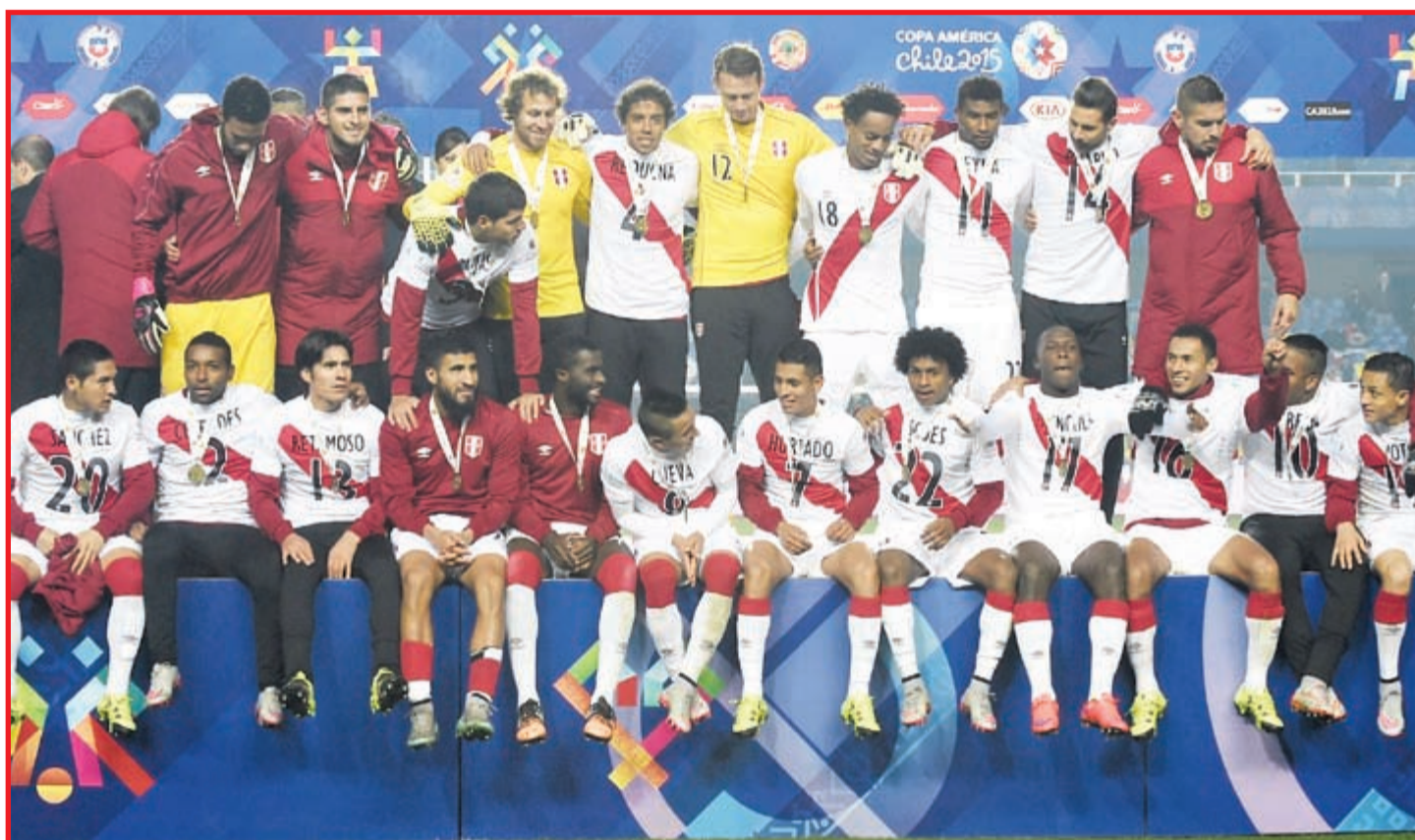
البيرو «ثالثة» كوبا أميركا على حساب باراغواي

تبحث الولايات المتحدة عن الثأر من اليابان عندما تلتقيان في نهائي كأس العالم للسيدات لكرة القدم المقامة بنسختها السابعة في كندا اليوم على ملعب «بي سي بلايس» في فانكوفر، فيما يريد المنتخب الاسوي رد الصاع بعد سقوطه في نهائي أولمبياد 2012. وكانت اليابان أحرزت لقبها الأول في تاريخها في نسخة الأخيرة عام 2011 في ألمانيا على حساب الولايات المتحدة 1-3 بركلات الترجيح بعد تعادلهما 2-2 في الوقتين الأصلي والإضافي حارمة منافستها من لقبها الأول منذ 1999 والثالث في تاريخها. وبلغت اليابان النهائي للمرة الثانية على التوالي وفي تاريخها بفوزها القاتل في نصف النهائي على إنجلترا 2-1 الأربعاء الماضي، فيما