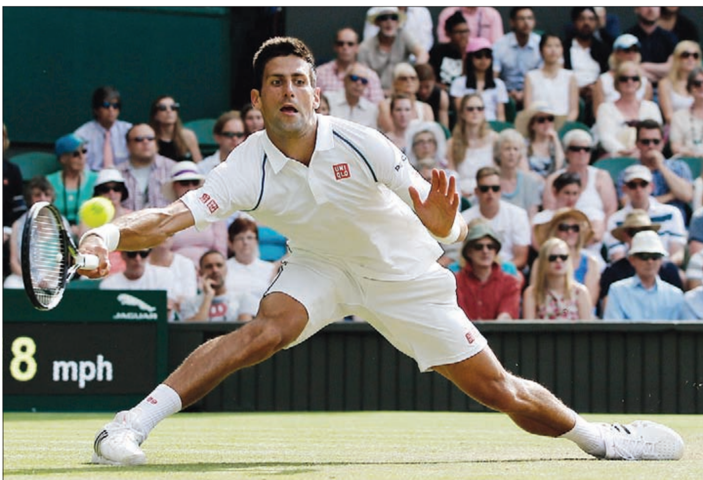
الصربي نوفاك ديوكوفيتش يواصل حملة الدفاع عن لقبه بنجاح

بينهما بعد دورتي روما ومونتريال للماسترز عام 2012، علما انهما كانا سيبلتقيان في ربع نهائي دورة انديان ويلز الأميركية هذا العام بيد ان الاسترالي انسحب بسبب الإصابة. ويلتقي ديوكوفيتش في الدور المقبل مع الجنوب افريقي كيفن أندرسون الرابع عشر والذي تغلب على الأرجنتيني ليوناردو ماير الرابع والعشرين 4-6 و7-6 (8-6) و3-6. وفي المباراة الخاتمة، لم يجد فافرينكا الساعي الى اللقب الكبير الاحترافي في مسيرته الاحترافية الثالث بعد مليونر عام 2014، اي عناء في التخلص من عقبة فرانسكو وحقق فوزه الثاني عليه في 4 مواجهات بينهما حتى الآن.