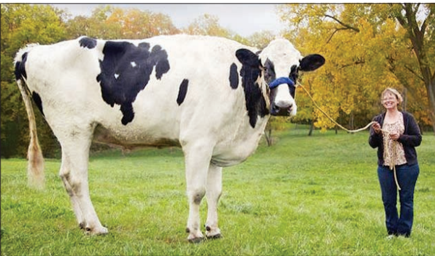
.. وأطول بقرة مع صاحبها

وتجدر الإشارة إلى أن «بلوسوم» نفقت بسبب إصابة في ساقها، ولم يمنحها ذلك في الحصول على لقبها الثاني في الموسوعة العالمية كأطول بقرة في التاريخ.