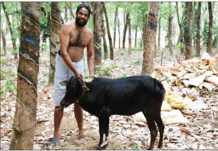
بقرة قزمة مع صاحبها

الماشية. ويقول الباحثون إن صغار المزارعين لا يحتاجون لأكثر من واحدة أو اثنتين من البقر القزم لتغطية حاجة أسرهم من الألبان. كما أن هذا النوع أقل عرضة للإصابة بالتهاب الثدي. ويقول باحثون إن مزارعي ولاية كيرالا يخسرون نحو 40 مليون دولار سنويا بسبب مرض التهاب الثدي في المواشي الهجين.