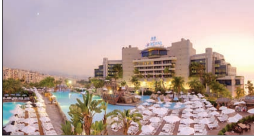
فندق ومنتجع لو رويال

منقطع النظير من حيث خيارات الجمال والترفيه في فرنسا، حيث سلسلة فنادق بارير تمتد لتصل إلى كان وباريس ودوفيل. وحضر حفل العشاء مايكل حداد، المدافع عن حقوق الإنسان والقضايا البيئية وحامل الرقم القياسي العالمي، حيث أخبر قصته المهمة بعنوان «كسر الحواجز» كوسيلة لتحقيق الأمل ومد الجسور بين المجتمعات، ولاقى مايكل ترحيباً كبيراً في فندق جي دبليو ماريوت في الكويت باعتباره جزءاً من مبادرة «روح الخدمة» العالمية التي أطلقتها فنادق ماريوت.