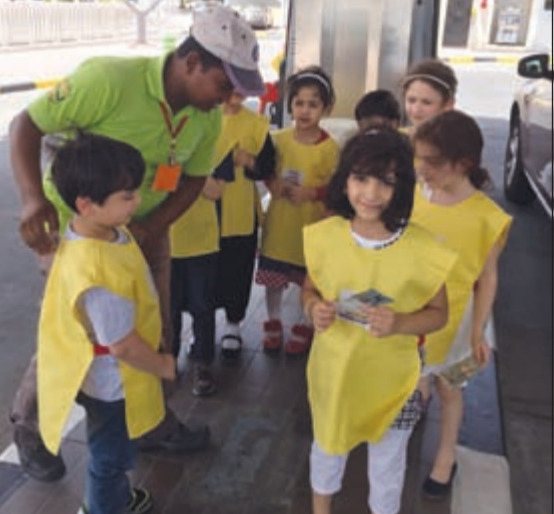
اطفال «الفصحى» مع أحد عمال محطة تزويد الوقود