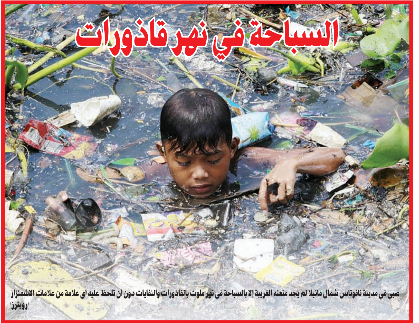
صبي في مدينة نافوتاس شمال مانبلا لم يجد متعنه الغربية إلا بالسباحة في نهر ملوث بالقاذورات والنفايات دون أن تلاحظ عليه أي علامة من علامات الاشمئزاز