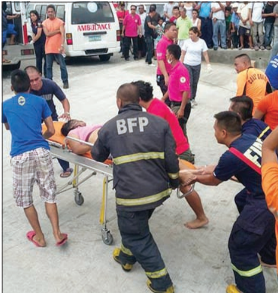
اسعاف احد المصابين

يذكر أن السفر بواسطة البحر من وسائل النقل المهمة في الفلبين وهي أرخبيل يضم سبعة آلاف جزيرة، ولكن الحوادث تعد أمرا معتادا بسبب معايير السلامة السيئة واكتظاظ السفن بأكثر من حمولتها.