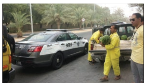
من حملة ملاحقة الباعة الجائلين في حولي

هذه الخضراوات تلتف بحكم وجودها في الأجواء الحارة وأنها منظر غير حضاري وهو أقرب ما يكون بالتسول. إلى ذلك كشف مصدر أمني أن قطاع الأمن العام وتعليمات من اللواء عبدالفتاح العلي وأصل حملاته على المتسولين