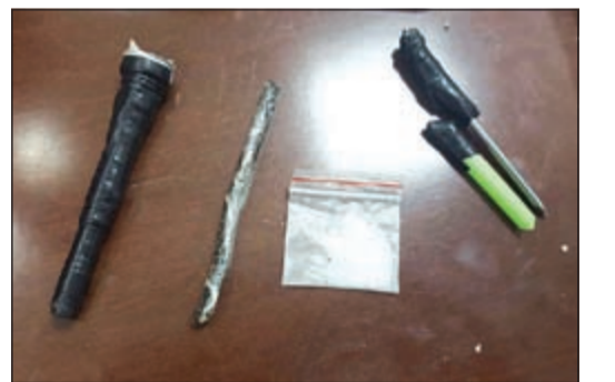
المخدرات التي ضبطت مع المواطن الخليجي في الصليبخات