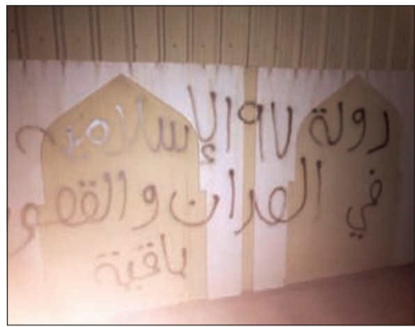
خبير الخطوط انتقل إلى مبارك الكبير لرفع الآثار

إلى جانب الأمن العام وذلك إثر ورود بلاغ عن شنته مشتبه فيها خلف فندق 5 نجوم في العاصمة وتبين أن الشنته لا تحوي مواد متفجرة بعد التعامل معها، كما قام رجال