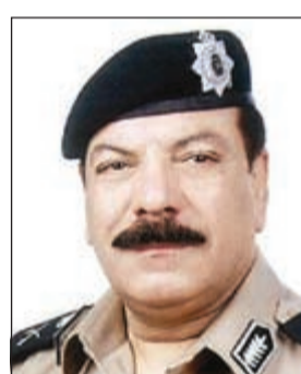
اللواء عبدالفتاح العلي

هذه الخضراوات تلتف بحكم وجودها في الأجواء الحارة وأنها منظر غير حضاري وهو أقرب ما يكون بالتسول. إلى ذلك كشف مصدر أمني أن قطاع الأمن العام وتعليمات من اللواء عبدالفتاح العلي وأصل حملاته على المتسولين