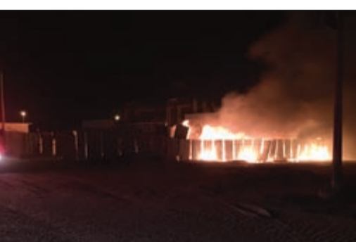
الأسنة النهب قبل إخمادها من قبل رجال الإطفاء