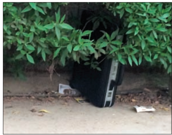
الشنطة التي اشتبهت رجال الأمن في احتوائها على مواد متفجرة

إلى جانب الأمن العام وذلك إثر ورود بلاغ عن شنته مشتبه فيها خلف فندق 5 نجوم في العاصمة وتبين أن الشنته لا تحوي مواد متفجرة بعد التعامل معها، كما قام رجال