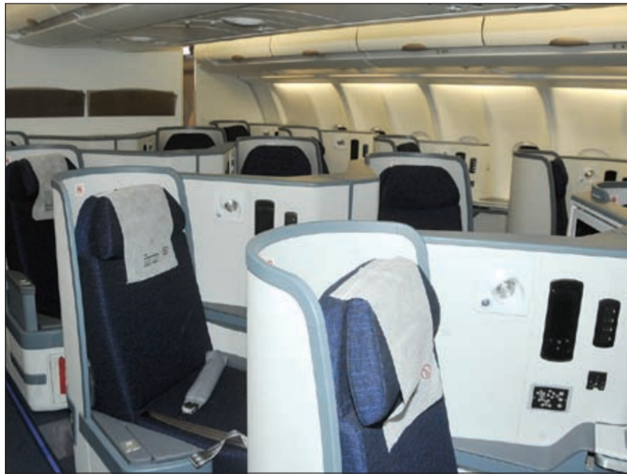
درجة رجال الأعمال على طائرة «الفنطاس» الجديدة لـ «الكويتية»

وأشار إلى أن طائرة الفنطاس A330 تعتبر من الطائرات الناجحة، وقد صنع منها حتى الآن أكثر من 880 طائرة، كما أنها تستخدم محركات من طراز رولز رويس والمعروفة