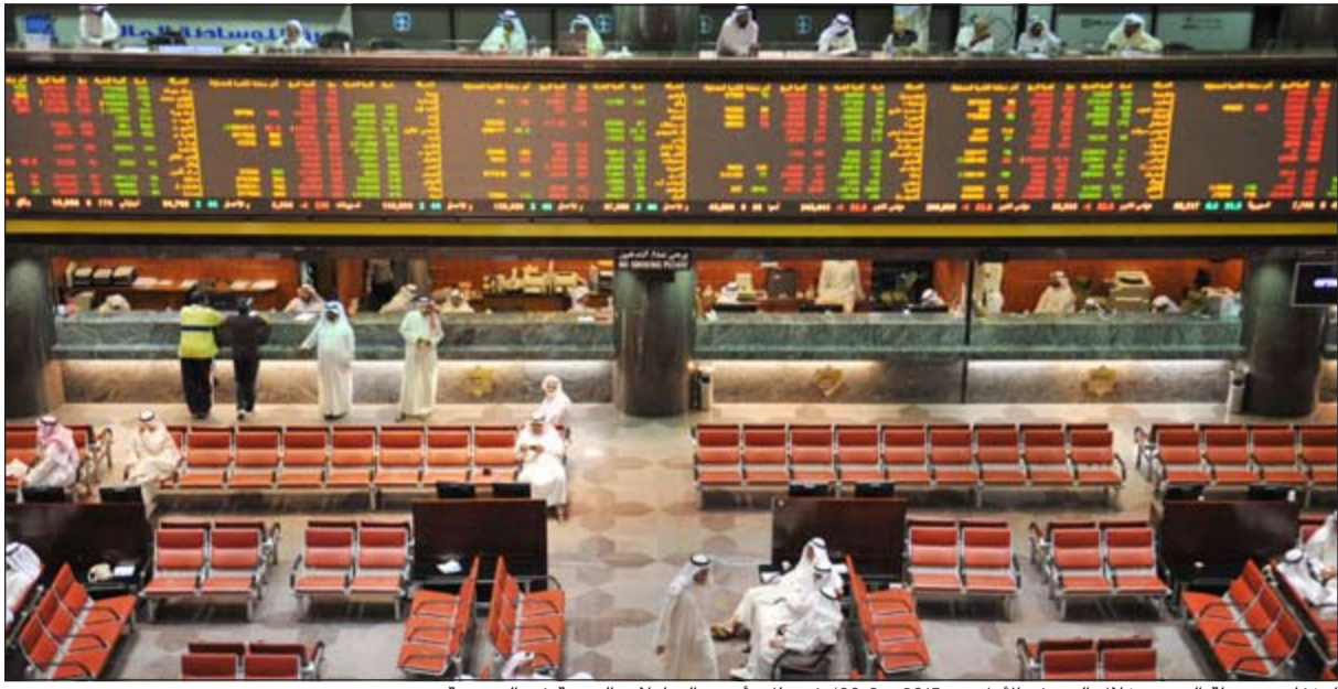
انخفاض سيولة السوق خلال النصف الأول من 2015، بـ30%، في ظل تراجع التعاملات اليومية في البورصة

ذكر تقرير اقتصادي صادر عن شركة الإستثمارات الوطنية أن سوق الكويت للأوراق المالية اختتم تعاملاته للسنة أشهر من عام 2015 على تراجع في مؤشرات العام، وذلك قياساً بنهاية العام 2014 حيث تراجع المؤشر السعري بمقدار 332,8 نقطة وبنسبة 5,1% والمؤشر الوزني بمقدار 18,9 نقطة وبمقدار 27,3 نقطة بنسبة 0,6% ومؤشر كويت 15 بمقدار 42,9 نقطة بنسبة 4,1%.