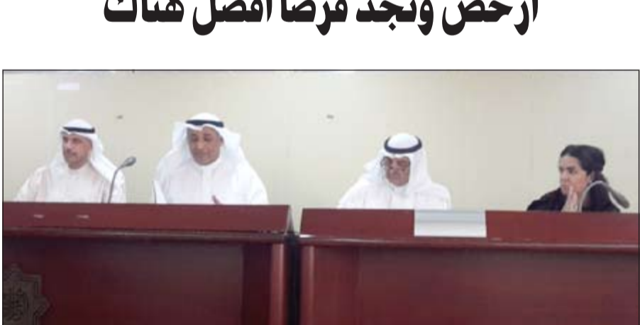
ديوس الديوس يتراأس عمومية الشركة (أحمد يوسف)

أعلن بنك غيتهاوس البريطاني عن نتائج المالية للفترة المنتهية في 31 ديسمبر 2014، حيث حقق البنك إجمالي إيرادات بلغ 24,2 مليون دولار بمهمة 18% لتصل إلى 413 مليون دولار مقارنة بنفس الفترة من 2013. كما زمت أرباح البنك الصافية لتبلغ 6,4 ملايين دولار، حيث ساهمت تلك الأرباح