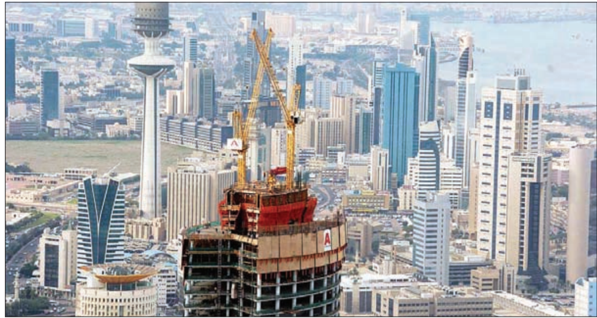
استمرار تراجع نشاط السوق العقاري خلال الأشهر المقبلة مع بداية إجازة الصيف وشهر رمضان

وكشف التقرير عن تراجع النشاط في قطاع العقار الاستثماري خلال مايو مقارنة بآداءه القوي الذي سجله في مايو 2014، حيث بلغ إجمالي مبيعات القطاع 115,2 مليون دينار، متراجعا بواقع 21٪ على أساس سنوي، إلا أن عدد الصفقات قد شهد تعافياً من تراجع الذي سجله خلال أبريل، إذ ارتفع عدد الصفقات بواقع 3,7٪ على أساس سنوي ليصل إلى 141 صفقة، ولا يزال متوسط حجم الصفقات للأشهر الخمسة الأولى من العام قوياً، مرتفعاً بواقع 19٪ عن مستواه الذي سجله العام الماضي. وقد شكلت الشقق الفردية 54٪ من إجمالي الصفقات، بينما شكلت المباني الكاملة 38٪ من إجمالي الصفقات. واحتلت محافظة الأحمدية مرة أخرى الصدارة من