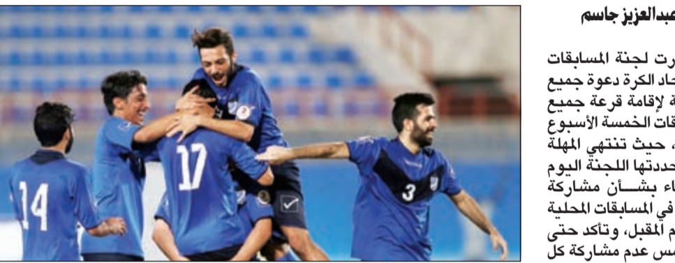
هل يعود التضامن عن قرار الانسحاب؟ (الأزرق، كوم)

قررت لجنة المسابقات في اتحاد الكرة دعوة جميع الأندية لإقامة قرعة جميع المسابقات الخمسة الأسبوع المقبل، حيث تنتهي المهلة التي حددتها اللجنة اليوم الثلاثاء بنشأن مشاركة الفرق في المسابقات المحلية الموسم المقبل، وتؤكد حتى يوم أمس عدم مشاركة كل من النصر والصلبختات والشباب والساحل في دوري الريدف، بينما ارسل الصليبختات كتابا بعدم رغبته في المشاركة في كأس الاتحاد الذي ينطلق 4 سبتمبر المقبل بنظام مجموعتين 7 فرق في كل مجموعة. في المقابل قرر الفحيحيل