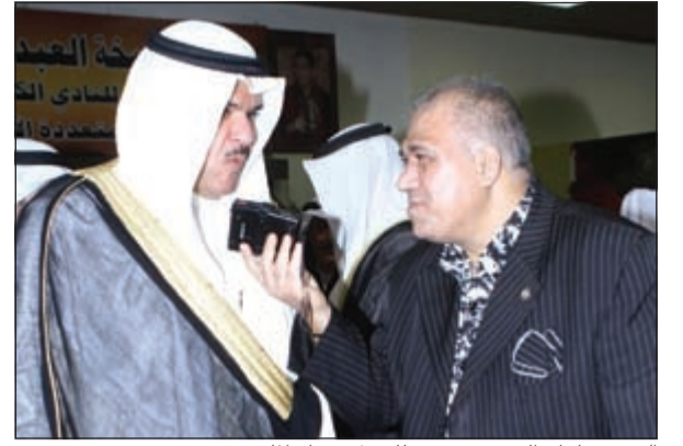
الشيخ سلمان الحمود يتحدث للزميل هشام المليجي

أكد وزير الإعلام ووزير الشباب الشيخ سلمان الحمود أن الجميع تشرف بزيارة صاحب السمو الأمير الشيخ صباح الاحمد وسمو ولي العهد الشيخ نواف الاحمد لنادي المعاقين، وهي من عادات سموه الحرص على زيارة أبنائه المعاقين وتشجيعهم. وأفاد بأن هيئة الشباب لا تدخر جهدا في توفير جميع الإمكانيات المتاحة لنادي المعاقين، وخصوصا المقر الجديد الذي يشتمل على جميع المواصفات العالمية والقانونية والعلاجية التي تناسب هذه الفئة وهم المعاقون. وبارك الشيخ سلمان للنادي بتحقيق الانجازات الدولية وطلبتهم بالمزيد من العطاء والنتائج، والشكر لرئيس النادي شافي الهاجري وجميع العاملين معه.