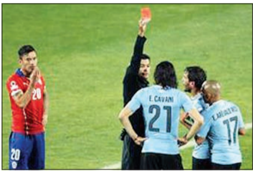
واقعة طرد كافاني التي تسبب فيها خارا

أعلن الاتحاد التشيلي لكرة القدم أول من أمس ان المدافع غونزالو خارا أوقف 3 مباريات بسبب قيامه بحركة غير رياضية ضد الأوروغوياني ايدنسون كافاني في المباراة بين المنتخبين في ربع نهائي كوبا أميركا 2015 المقامة في تشيلي. وقال الاتحاد التشيلي في بيان انه «أخذ علما بعقوبة الإيقاف 3 مباريات التي فرضت على غونزالو خارا من قبل الاتحاد الأميركي الجنوبي». وأضاف البيان «نحن نأسف لهذا القرار لكننا نتقبله».