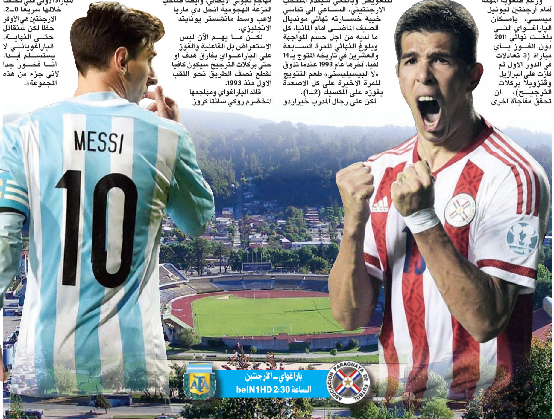
باراغواي - أارجنتين الساعة 2:30 beln1HD

ورغم صعوبة المهمة أمام أرجنتين ليونيل ميسي، بإمكان الباراغواي التي بلغت نهائي 2011 دون الفوز بأي مباراة (3 تعادلات في الدور الأول ثم فازت على البرازيل وفرنزويلا بركلات الترجيح)، ان تحقق مفاجأة أخرى