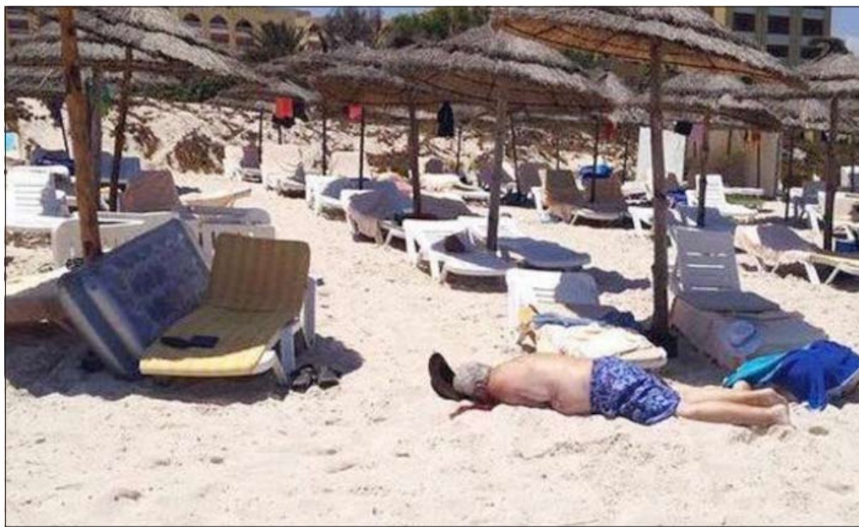
صورة لأحد ضحايا هجوم سوسة أمس

الهجوم الذي اسفر عن مقتل شخص وجرح آخرين. وأفاد مصدر أمني بأن القضية أسندت لوحدة مكافحة الإرهاب بباريس، فيما اشار مكتب ممثل الادعاء في باريس في بيان الى فتح تحقيق في اتهامات بالقتل والشروع في قتل في إطار جماعة منظمة لها علاقة بالإرهاب. وأشارت وسائل الإعلام الفرنسية الى أن الرجل الذي أوقفته الشرطة لا يحمل بطاقة هوية ويرفض التحدث مع الشرطة.