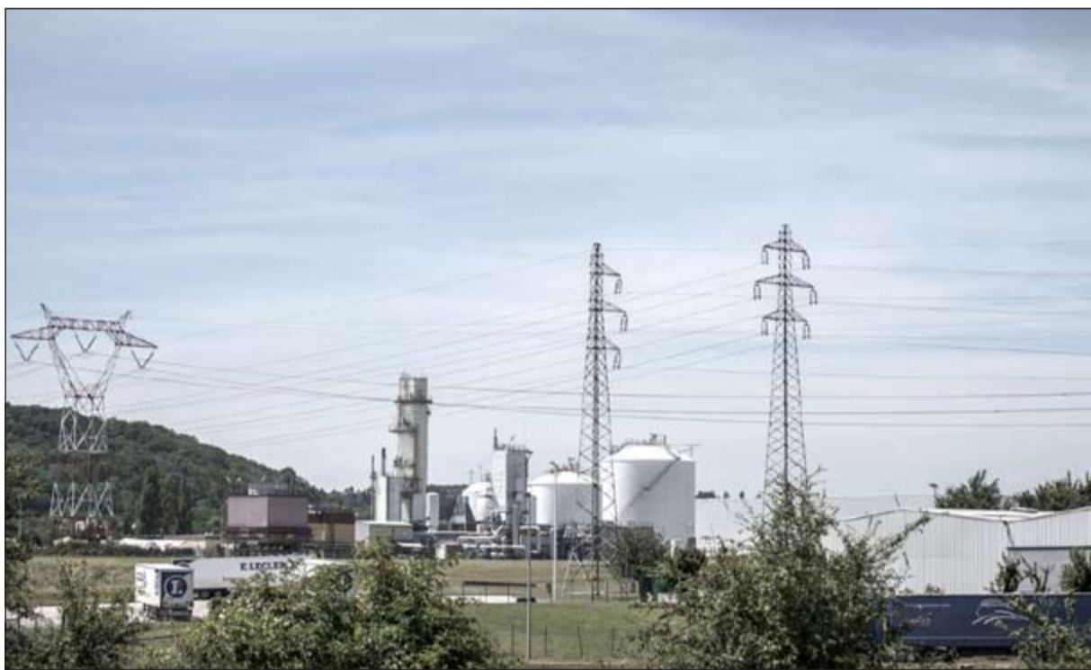
صورة لمصنع «اير بروكتس» للغاز قرب مدينة ليون الذي استهدفه الهجوم امس (أ.ف.ب)