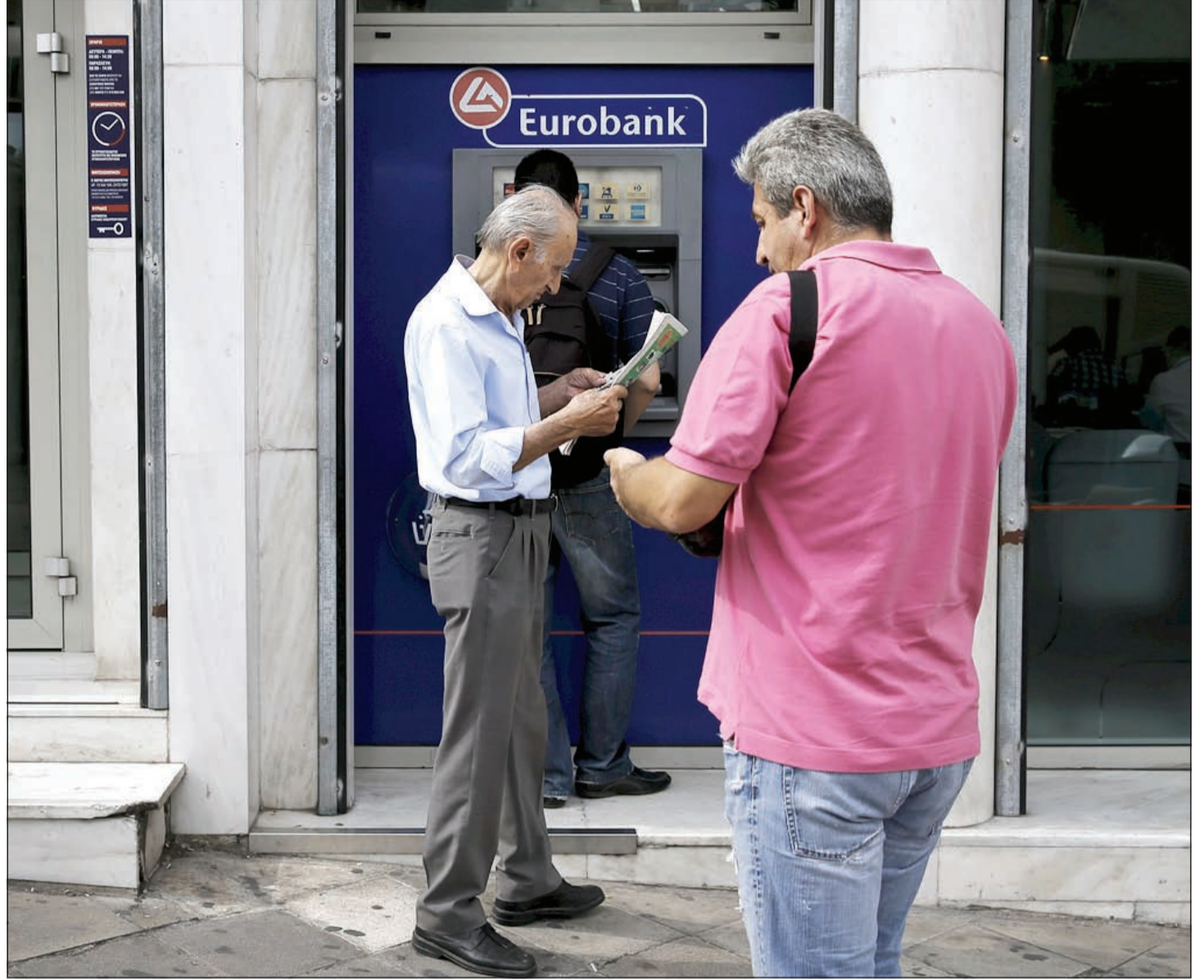
مواطنون يونانيون ينتظرون دورهم لسحب أموالهم من أحد البنوك في العاصمة أثينا حيث أدت الأزمة اليونانية إلى سحب الودائع الأعلى مستوى منذ 11 عاماً

1 غلبة العامل التشغيلي في نشاطها 2 مستمرة في تحقيق وتوزيع الأرباح.