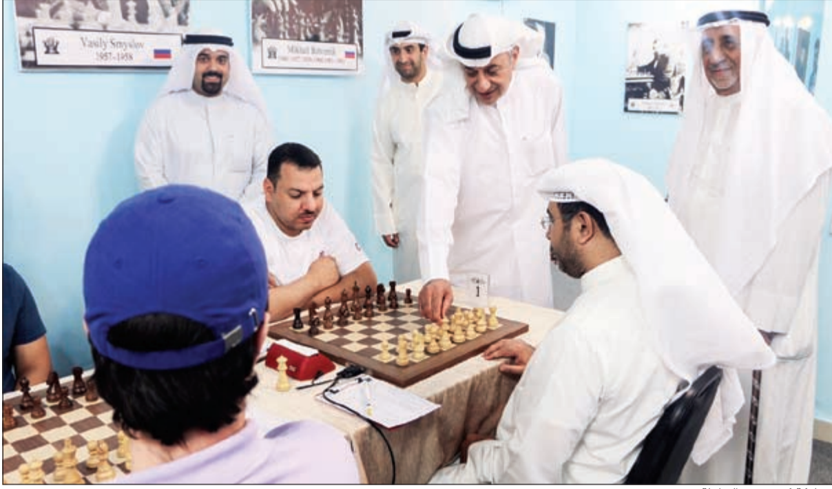
مشاركة كبيرة في البطولة