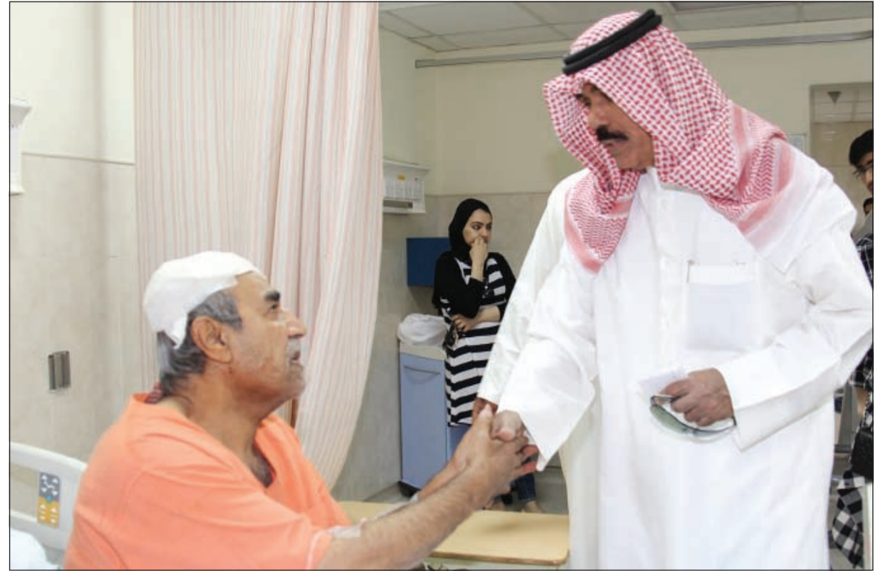
سمو ولي العهد الشيخ نواف الأحمد خلال تفقده المصابين