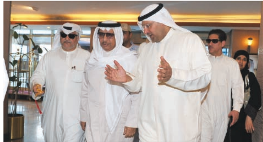
سمو رئيس الوزراء الشيخ جابر المبارك خلال تفقده المستشفى الاميري مع د.علي العبيدي (قاسم باشا)

وأعلنت وزارة الصحة رفع درجة الاستعداد القصوى في جميع اقسام الحوادث في مستشفيات الكويت وتفعيل خطة الطوارئ القصوى، وذلك بعد ما حدث من تفجير في مسجد الإمام الصادق بمنطقة الصوابع. ودعت «الصحة» المواطنين والمقيمين، أنه ونظرا لهذه الأحداث الطارئة، بأن يراجع المرضى من ذوي الاعراض غير الطارئة المستوصف بدلا من الاتجاه الى اقسام الحوادث في المستشفيات، مؤكدة أن تجهيز واكتظاظ اقسام الحوادث بالجمهور ونحو المصابين قد يؤثر على انسيابية حركة الاسعاف والمصابين، وبالتالي