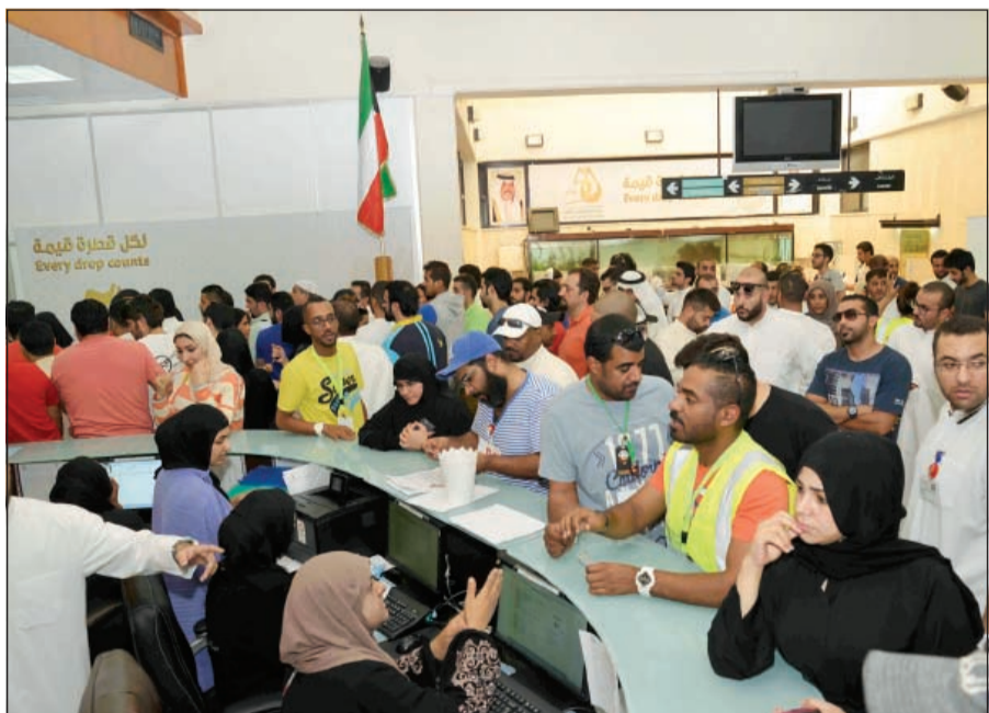
بنك الدم شهد زحاما شديدا

وقال رئيس مجلس الأمة مرزوق الغانم: لقد حضرت مع عدد من اعضاء المجلس لزيارة الجرحى في المستشفى الاميري والحمد لله اطمأنتت على حالتهم، وأضاف: إذا كان من وراء هذا المخطط يرى انه سينجح بهذا العمل في تقسيم الكويتيين إلى ستة وشيعة فاقول له وكل الاخوة النواب وطوائف المجتمع وحتى من الجرحى انفسهم وهم لم يتشاقوا بعد «لا أحد يستطيع أن يفرقنا». وأضاف: نحن مجتمع صغير وحادث مثل هذا يؤثر ولكن بالتاكيد تأثيره سيكون عكسيا على أهداف من وراءه وأكد للجمع داخل الكويت وخارجها رغم عظم المصاب الجلل ككويتيين اننا سنخرج أقوى واكثر تمسكا