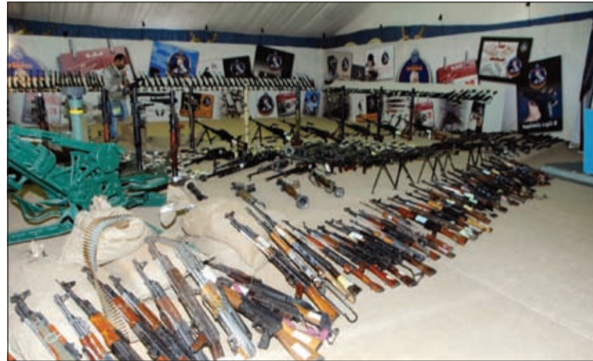
«الداخلية» تستعد لشن حملة عقب انتهاء المهلة