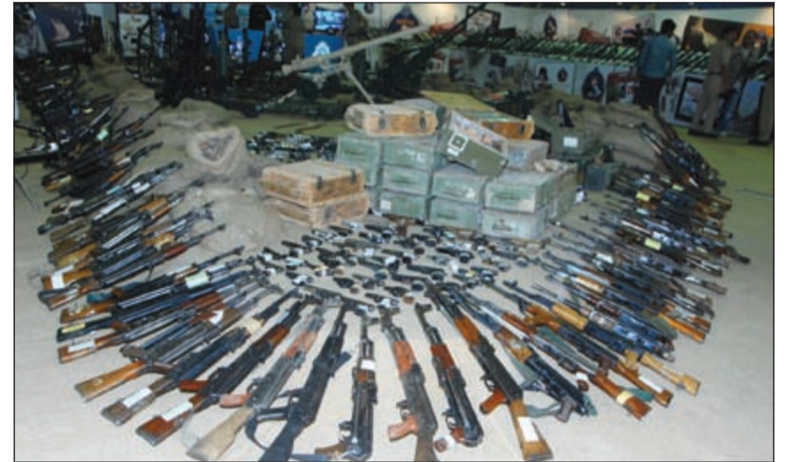
6730 سلاحا حصيلة حملة جمع السلاح

للخطاب الديني من خطب يوم الجمعة والبرامج الإذاعية والتلفزيونية ومطبوعات الوعظ والإرشاد والتي بينت الوجه الشرعي والموقف الفقهي عن خطورة السلاح في ترويع الأمنين كان له دور كبير.