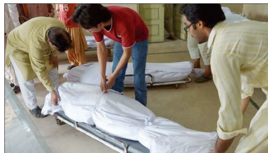
انشاء مراكز متخصصة لتفادي ضربات الشمس

وزير الصحة في إقليم السند وعاصمته كراتشي لوكالة فرانس برس بأن «حصيلة الوفيات بلغت 800، بحسب المعلومات التي جمعت حتى منتصف الليل»، مرعبا عن خشيتيه من ارتفاع الحصيلة أيضا خلال النهار.