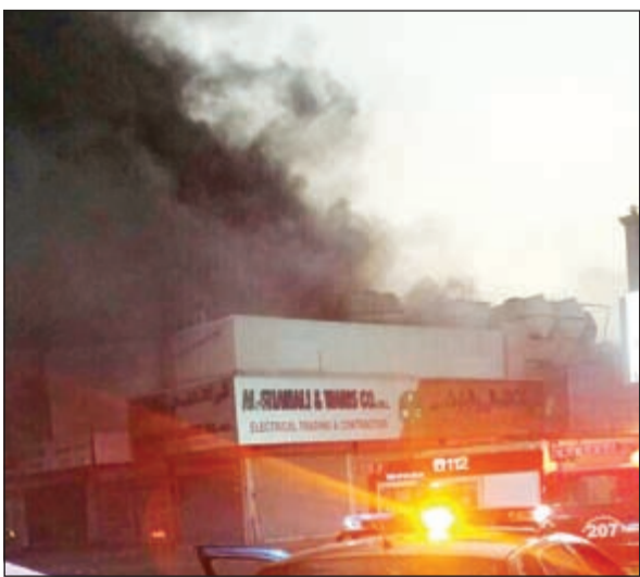
الدخان غطى سماء الشويخ أمس الخميس بفعل الحريق