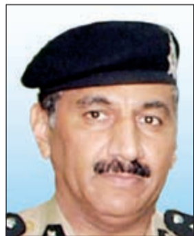
اللواء فهد الشويخ