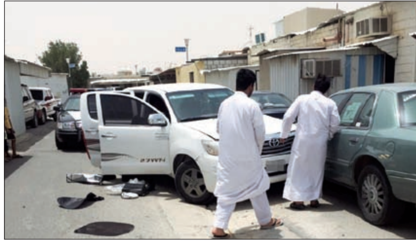
الجنّة تركوا السيارة بعد الاصطدام وهربوا إلى جهة غير معلومة

بعدها ادركوا في الغالب انه لا احد في الداخل باستثناء العامل، حيث ابلغوا الحارس بانهم من مباحث السلاح وانهم يبحثون عن اسلحة. ومضى المصدر بالقول: سارع الوافد الى ابلاغ كفيله والذي كان قد خرج للتو من المزرعة فعدا سريعا اليها، وما ان شاهده للصووص حتى هربوا لتتسم اصطدامتهم، وخلال المطاردة اصطدمت مركبتهم فتركوها وهربوا على الأقدام، وتبين ان المركبة التي كانوا يستقلونها مسروقة.