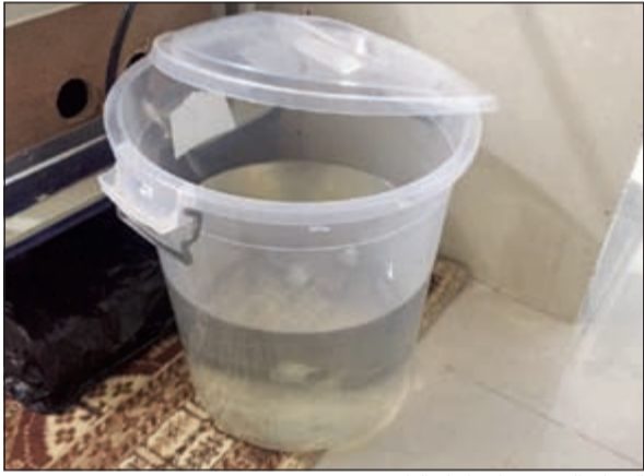
السطل الذي سقط بداخله الطفل

كميات كبيرة من الماء. وذكر المصدر أن الطفل من مواليد 2013 وجار استكمال الإجراءات وعمل محضر معاينة، وتمت إحالة القضية للتحقيق.