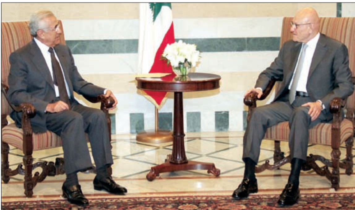
رئيس مجلس الوزراء تمام سلام مستقبلاً الرئيس العماد ميشال سليمان في السراي الحكومي

احترام النصوص الدستورية والقانونية، وإذ اعتبر ان لبنان ليس مكسوراً مالياً بل هو مسروق، سال: من تمثل الهيئات الاقتصادية؟ من الشعب؟ وأضاف: ان من يدعي ان الوضع المالي غير جيد، يريد النيل منّا لتخريف الشعب، وعدم اعطاء الحقوق لأصحابها، وقال ان بين يديه دراسة تتحدث بالارقام عن ان الوضع الاقتصادي جيد جداً.