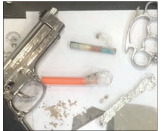
المضبوطات اُحيلت إلى الاختصاص