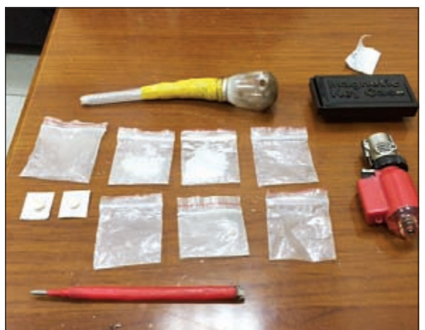
من مضبوطات منطقة الجليب

أنقذ رجال الإطفاء العشرات من سكان بناية في المهبولة اثر حريق شب في إحدى الشقق، وكان قد ورد بلاغ الى غرفة العمليات في الإدارة العامة للإطفاء فجر اليوم بفيد بوجود حريق عمارة في المهبولة، وعلى الفور هرع رجال اطفاء مركز المنقف والفحجيل الى موقع الحادث وعند الوصول تبين ان الحريق في عمارة مكونة من 7 أدوار وأن الحريق في شقة بالدور الثاني وعلى الفور تم إخلاء العمارة من السكان وانقاذ عشرات الأشخاص من النيران التي أصابت معظمهم باختناق اثر الدخان الكثيف، وتم تسليم المصابين الى الطوارئ الطبية وأجريت عملية مكافحة النيران والسيطرة عليها وأخادها في وقت قياسي.