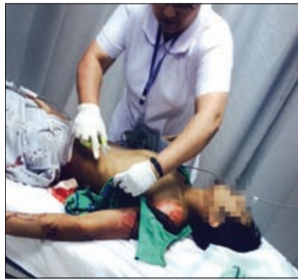
المجني عليه خلال تلقيه العلاج في مستشفى الجهراء

على الفور غرفة الانعاش حيث تمكن الاطباء من عمل الاجراءات اللازمة للشاب الذي وصف المصدر حالته بأنها خطيرة، وأردف المصدر بأن صديق المجني عليه قام بإسعاف صديقه بعد ان شاهده يتعرض للطنع على يد شخص يعرفه في منطقة سعد العبدالله وزود رجال الامن ببيانات الجاني وجار التحقيق بالواقعة ومعرفة اسباب المشاجرة.