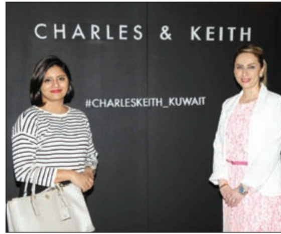
الاعلان عن اطلاق تشكيلة «تشارلز وكيث»