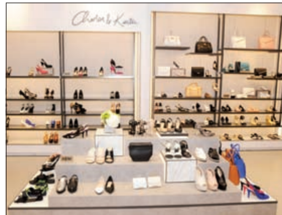
مجموعة رائعة من الأحذية

الأحذية: الصنادل المكشوفة، أحذية الكعب المقوس، الأحذية الرياضية، أحذية دي أورسيه، صنادل