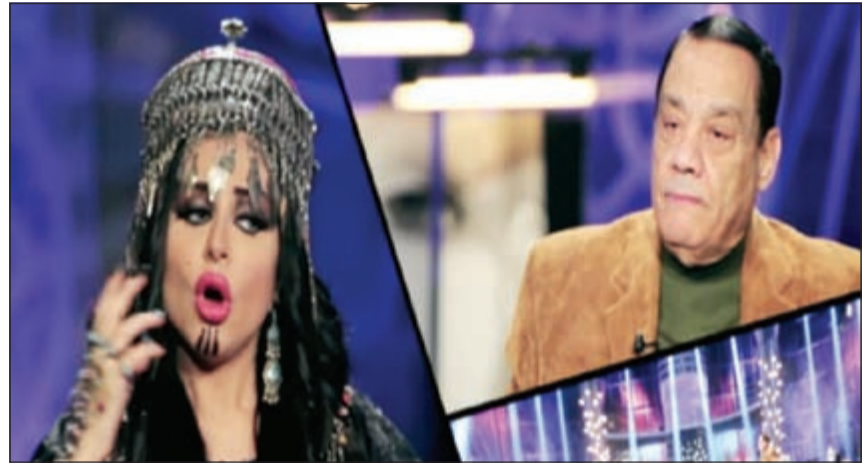
حلمي بكر خلال استضافته في برنامج «سر حليمة».

استغربت سندرديلا المذيعات الاعلامية حليمة بولند هجوم فنانزات «الملكة احلام» عليها وعلى فنانزاتها في مواقع التواصل الاجتماعي وذلك بعد انتهاء حلقتها مع الموسيقار حلمي بكر من خلال برنامجها سسر حليمة الذي يعرض على قناة السراي والمحور حيث وصف بكر الملكة احلام بانها ليست لديها خبرة اكااديمية في الساحة الغنائية خصوصا بعد ان وصفت صوت باسمينا الموهبة التي شاركت في برنامج ارب غالنت بأنه مستعار.