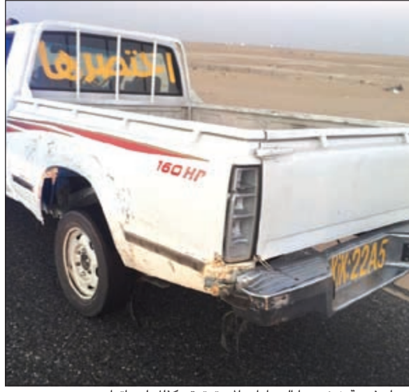
اسماء غربية زينت بها السيارات المستهترة وكذلك لوحاتها