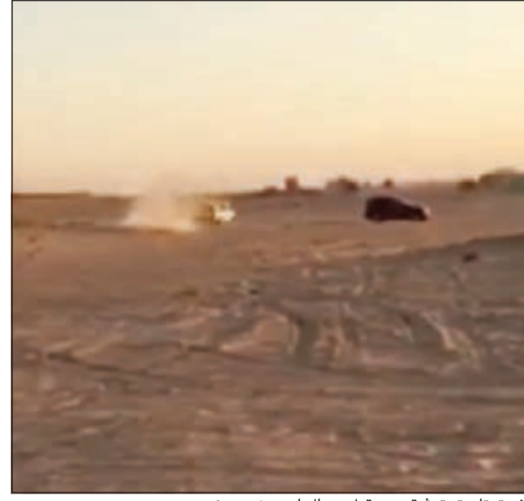
الاستهتار تم توثيقه من قبل رجال أمن بزّي مدني