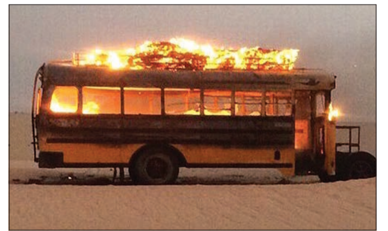
النييران وهي تلتهم الباص

الباص. وقال مصدر أمني ان احد المارة ابلغ عن حريق باص وسط بر السالمي، فتوجه رجال اطفاء السالمي نوبة بقيادة الخنفور وتم اخماد النييران التي تبين انها التهمت الباص الذي لم تعرف أسباب اشتعاله.