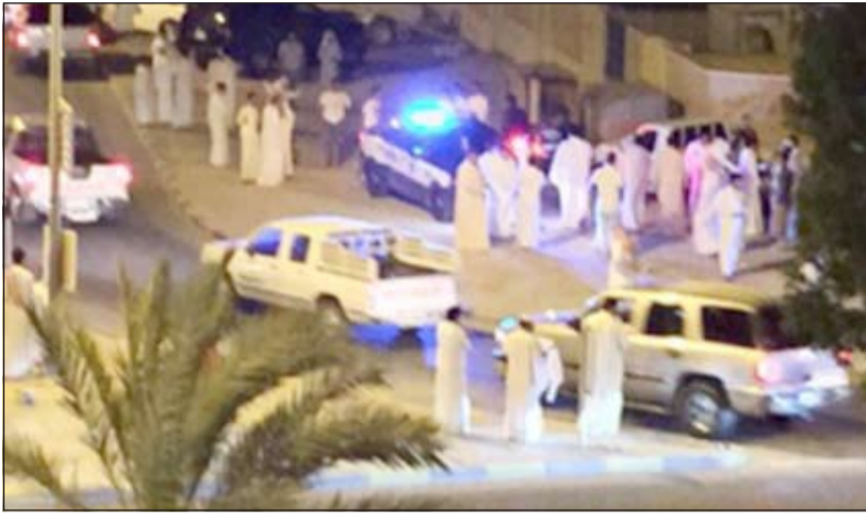
تجمهر حول مكان الاصطدام

رجال الأمن ومقاومتهم، وأردف المصدر أنه أثناء ضبط المتهم ومحاولة إصعاده الدورية قام المتجهرون باللقاء الحجارة على رجال الأمن