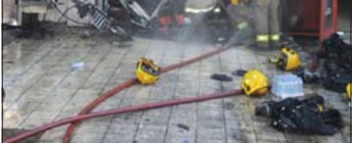
الحريق خلف خسائر مادية

ورد بلاغ إلى غرفة عمليات الإدارة العامة للإطفاء مساء أمس يفيد بنشوب حريق في أحد محال الشويخ الصناعية، وعلى الفور توجه رجال مراكز إطفاء الشويخ والعارضية والإسناد وعند وصولهم إلى موقع الحادث تبين أن الحريق في محل لقطع الغيار وتم توزيع فرق المكافحة على الحريق وتمت السيطرة على النيران وإخمادها.