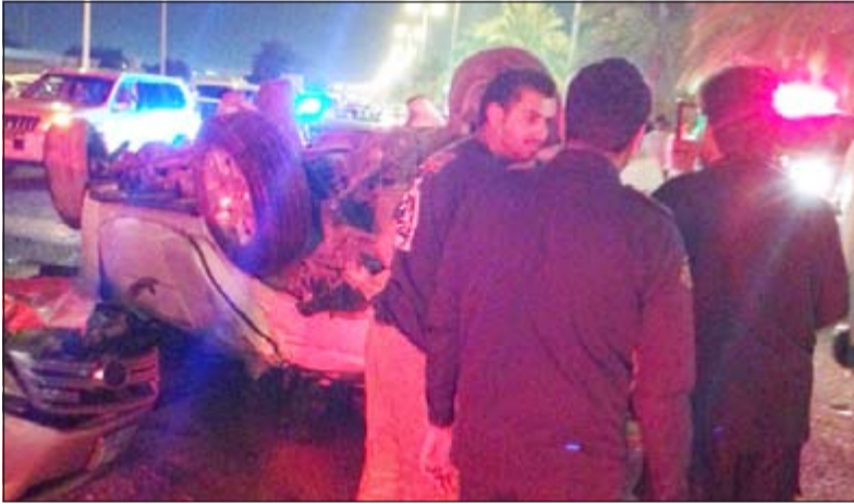
الحادث وقع بين منطقتي النعيم والتيماه وكان بين ثلاث سيارات

بعمود الإنارة ويقتمح الطريق المعاكس مما تسبب في انقلاب سيارته والاصطدام بسيارتين وتم نقل المصابين وعددهم 9 أشخاص ووصفت حالتهم بالاستقرة.