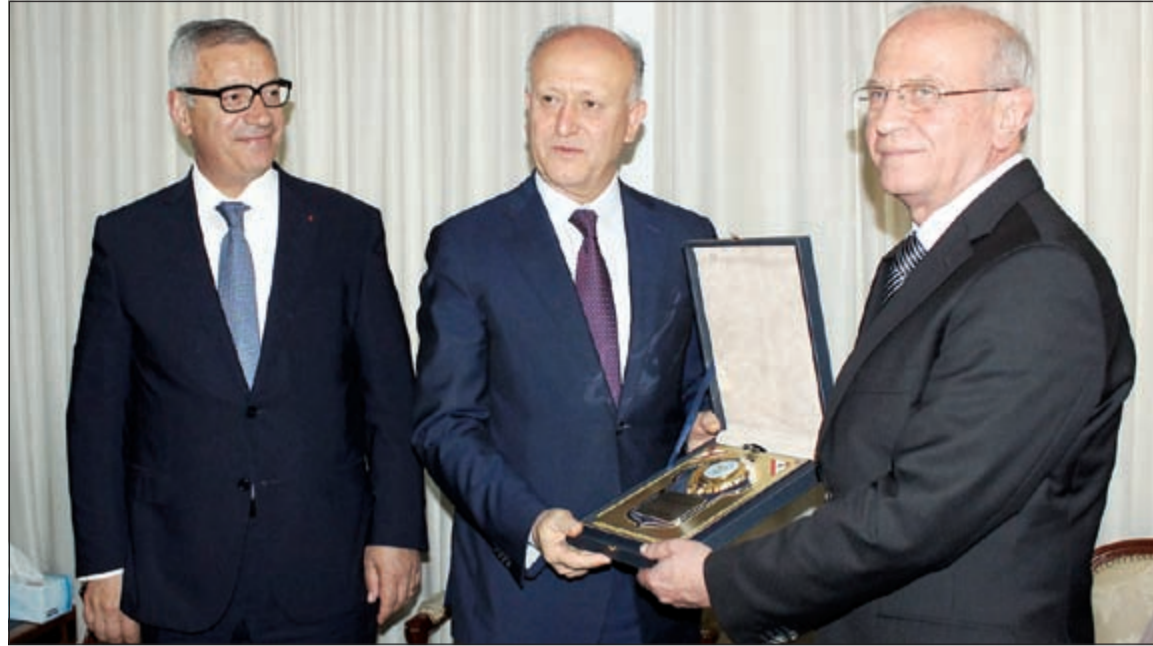
وزير العدل أشرف ريفي مكرما المدعي العام التمييزي القاضي سمير حمود بحضور رئيس مجلس القضاء الأعلى القاضي جان فهد (محمود الطويل)