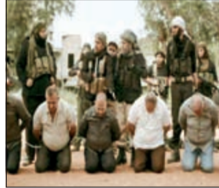
ناصر القصبي في «سليفي»

نجاح عبدالله السدحان وناصر القصبي في عملهما الرمضاني هو نجاح للفن السعودي والتي يحارب