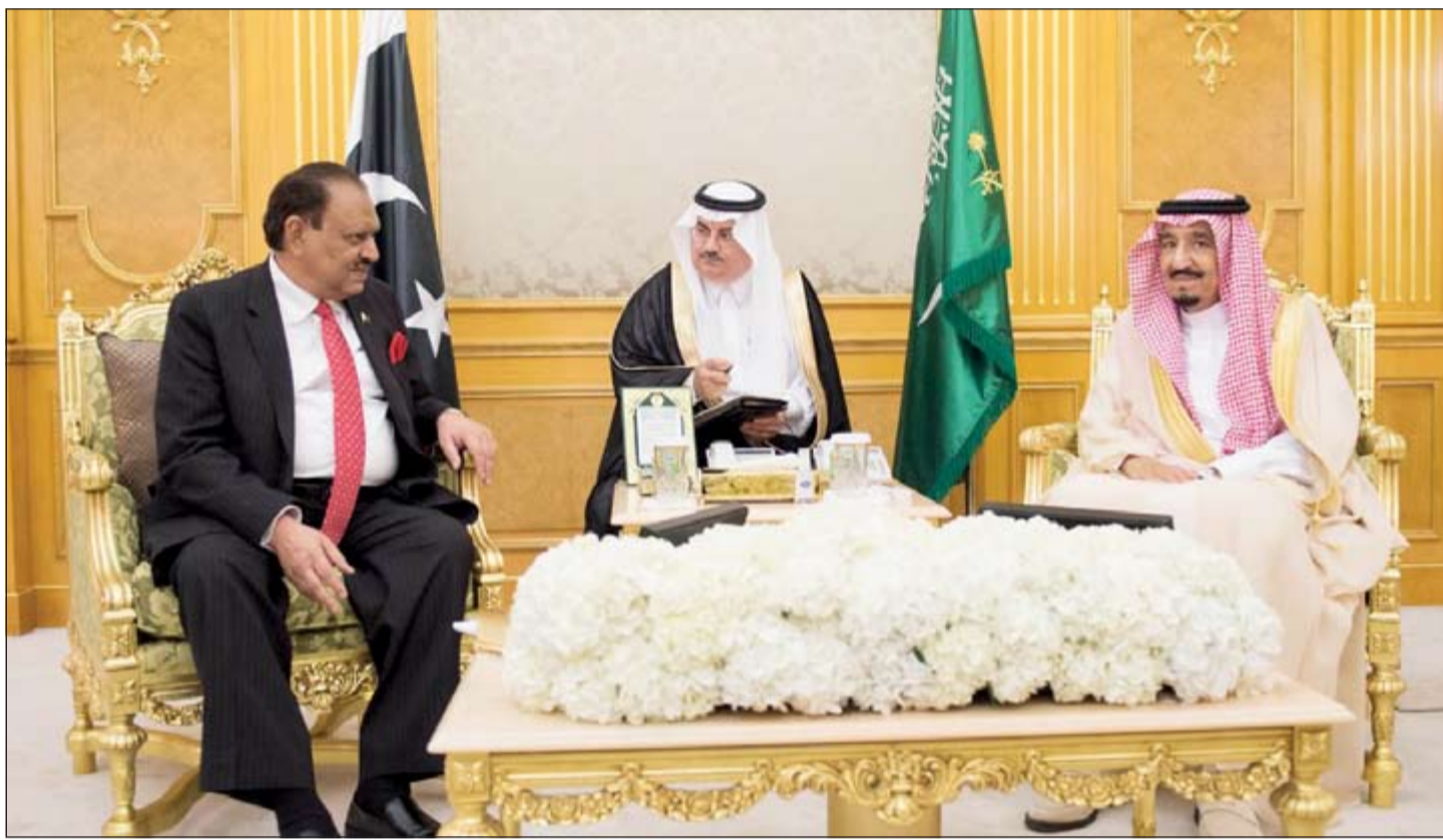
خادم الحرمين الشريفين الملك سلمان بن عبدالعزيز خلال مباحثاته مع الرئيس الباكستاني ممنون حسين في جدة امس الاول

موسكو - قناة العربية: وقَّعت المملكة العربية السعودية وروسيا 6 اتفاقيات للتعاون الاستراتيجي، على رأسها اتفاقية تعاون في مجال الاستخدام السلمي للطاقة النووية، وتفعيل اللجنة المشتركة للتعاون العسكري والتعاون في مجال الفضاء، إضافة إلى اتفاقيات تعاون في مجال الإسكان والطاقة والفرص الاستثمارية. جاء ذلك خلال زيارة صاحب السمو الملكي الأمير محمد بن سلمان ولي ولي العهد وزير الدفاع، إلى روسيا، حيث التقى الرئيس الروسي فلاديمير بوتين في سان بطرسبورغ. وفي السياق ذاته، كشفت عبر مصادر خاصة لقناة «العربية» عن اعتراف السعودية ببناء 16 مفاعلاً نووياً للأغراض السلمية ومصادر الطاقة والمياه، حيث سيكون لروسيا