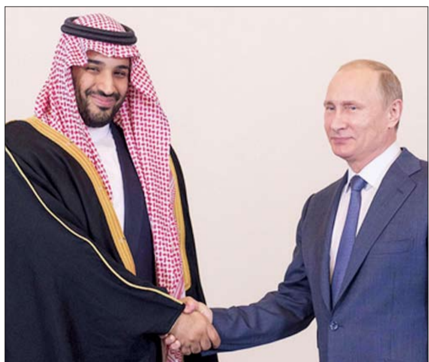
صاحب السمو الملكي الأمير محمد بن سلمان ولي ولي العهد النائب الثاني لرئيس مجلس الوزراء وزير الدفاع السعودي والرئيس الروسي فلاديمير بوتين قبيل مباحثاتهما في موسكو امس الاول (العربية نت)

الدور الأبرز في تشغيل تلك المفاعل. وقال موفد «العربية» إلى موسكو إن لقاء الأمير محمد بن سلمان والرئيس بوتين تمحور حول تطوير العلاقات بين البلدين، إضافة إلى بحث أوضاع المنطقة خاصة في: سورية والعراق واليمن ولبنان. وأشار إلى أنه كان لافتاً عزم المملكة الاستثمار في المجال الزراعي والاستحواذ على شركات زراعية داخل روسيا، وذلك بهدف توفير ضمان للأمن الغذائي للسعودية، وتحقيق عائدات استثمارية شبه مضمونة. إلى ذلك، لفت موفد العربية إلى أنه أثير نقاش حول التعليم وسبل تعزيز الشراكة بين البلدين في هذا المجال وإمكانية رفع عدد المتبعثين إلى روسيا إلى 500 العام المقبل.