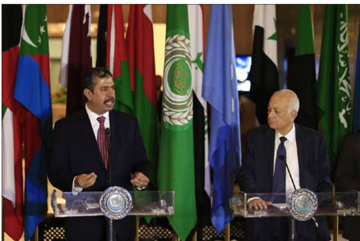
نائب الرئيس ورئيس وزراء اليمن خالد بحاح وامين عام الجامعة العربية نبيل العربي خلال مؤتمرهما الصحافي المشترك في القاهرة امس الاول

اعتقال المشتبه بإطلاقه النار داخل كنيسة للسود في أميركا. وتوقيف ديوان روف (21 عاماً) في كارولينا الشمالية. مقتل 9 اشخاص بإطلاق نار داخل كنيسة للسود في تشارلستون. تشارلستون، ولاية كارولينا الجنوبية. المواتر المتحدة. 50 كلم. أ.ف.ب: أعلنت السلطات في مدينة تشارلستون بولاية كارولينا الجنوبية الأميركية عن اعتقال الشاب الأبيض ديوان روف المشتبه في إطلاقه النار داخل كنيسة للسود، وذلك بعدما أسفر الحادث عن مقتل تسعة أشخاص في أسوأ هجوم عنصري في التاريخ الحديث للولايات المتحدة. وتولت طائرة نقل الشاب روف (21 عاماً) إلى مركز اعتقال في تشارلستون، حيث كان قد ارتكب مجزرتة بعدما اعتقل في وقت سابق في شيلبي بكارولينا الشمالية. وكان روف دخل الكنيسة لمدة ساعة قبل أن يبدأ بإطلاق النار على المصلين ويردي تسعة منهم. وتعليقاً على الحادث، دعا الرئيس الأميركي باراك أوباما إلى