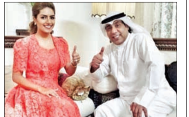
مسلسل «في عينها أغنية»

استطاعت شركة telly ان تستحوذ على حقوق مسلسل «في عينها أغنية»، وذلك لجذب محبي الفنانين المشاركين لتتابعته عبر telly مع امكانية وضع تعليقاتهم على جميع الحلقات والتي ستكون ظاهرة للجميع، بالإضافة الى ان الشركة سترصد نسبة المشاهدة للمسلسل بطريقتها الخاصة.. خووش فكرة.