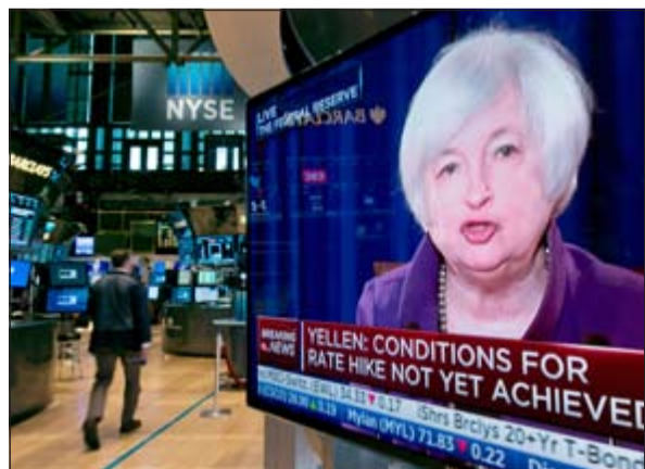
رئيس مجلس الاحتياطي الفيدرالي الاميركي جانيت يالين على شاشة التلفزيون في بورصة نيويورك أمس حيث أبقي المركزي الأميركي على معدلات الفائدة دون تغيير

المجلس الاحتياطي ان سوق العمل تواصل تحسنها لكن من المتوقع أن تظل البطالة أعلى قليلا في نهاية السنة مقارنة مع التوقعات السابقة في مارس.