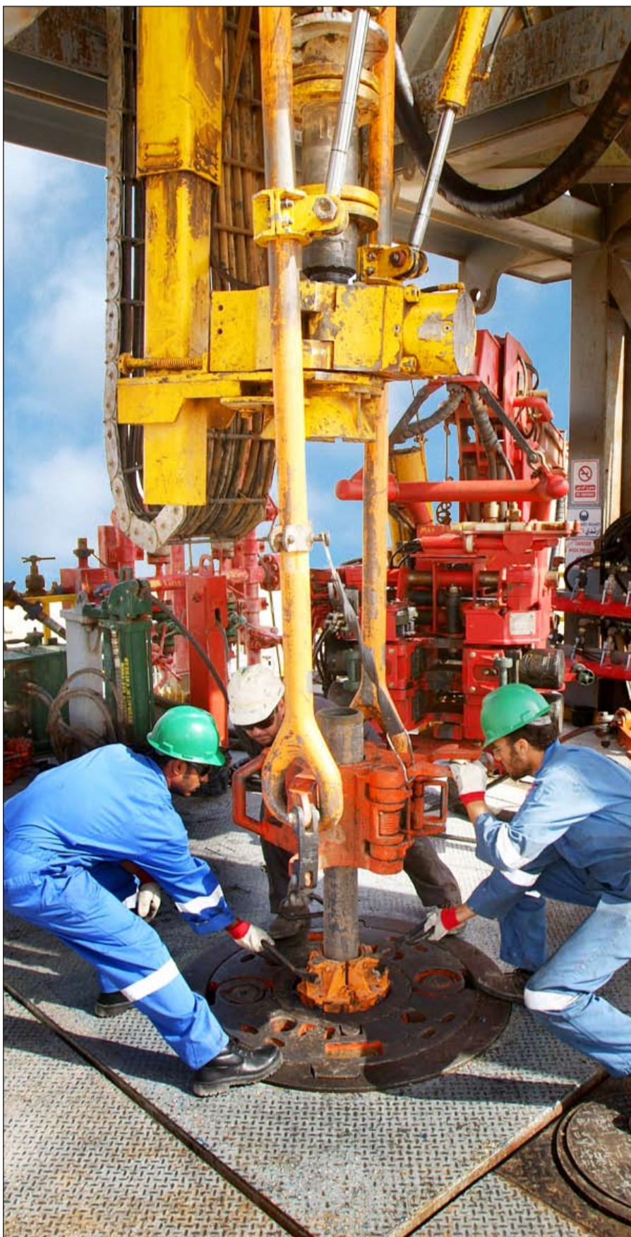
نפט الكويت تمشي قدما نحو تحقيق استراتيجية 2030 بتحقيق طاقة إنتاجية تبلغ 3,650 ملايين برميل يوميا

التي تم إدخالها إلى الخدمة في الربع الثالث من السنة المالية الماضية والذي يستخدم أحدث التكنولوجيا والنظم ومنشآت الاتصال المتقدمة والتي من شأنها إتاحة استخدام أحدث الوسائل التكنولوجية والنظم ومنشآت الاتصال المتقدمة والتي يمكنها من متابعة عمليات الحفر أول بأول.