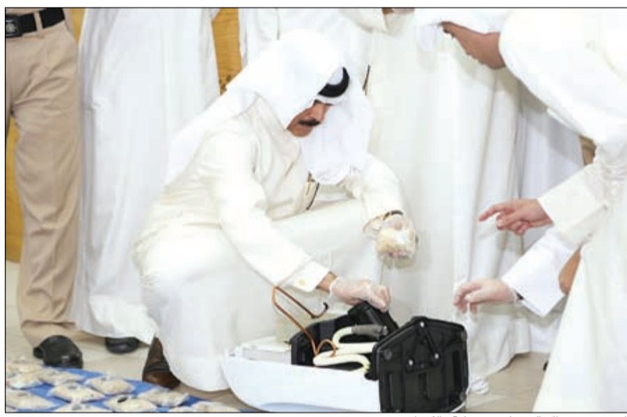
الشيخ محمد الخالد يعاين ضبطية «الكبتاغون»

تدشين 7 مراكز لمكافحة المخدرات وملاحقة المهربين عبر الإنترنت ضبط 1,170 مليون حبة كبتاغون بـ 2,5 مليون دينار