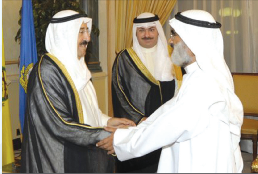
صاحب السمو الأمير الشيخ صباح الأحمد مصافحاً د. عجيل النشمي بحضور الشيخ خالد العبدالله

ويكيد بعضهم لبعض وتشيع مناهج وضعية أملتها الأهواء وشكلتها الغايات والأغراض وفسرتها الأفهام وفق المصالح الشخصية، والعدو يستغل كل ذلك لمصلحته ويزيد هذه النار اشتعالاً فيفرقهم في الحق ويجمعهم على الباطل ويحرم عليهم اتصال بعضهم ببعض وتعاون بعضهم مع بعض ويحل لهم الصلة به والالتفاف حوله، فلا يقصدون إلا داره ولا يجتمعون إلا زواره، وتلك الوطنية زائفة لا خير فيها لدعاتها ولا للناس، ثم يقول: هانت ذا قدر رأيت أننا مع دعاة الوطنية بل مع غلاتهم وفي كل معانيتها الصالحة التي تعود بالخير على البلاد والعباد.