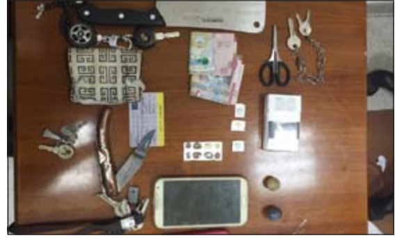
مواد مخدرة مضبوطة في الجهاز

ورغم ما تشهده الطرقات من اختناقات مرورية تزامنا مع شهر رمضان إلا ان الحملات تقام في ساعات متفرقة تقام في تعوق الحركة، وبحسب مصدر امني فإن قطاع الأمن العام نفذ يوم أمس 22 نقطة تفتيش مواطن عن ضبط 13 مطلوبيا، بواقع 4 مطلوبين جنائيا وخلال قيامهم بجولة أوقفوا أسبوية للاستتباب، ولدى الاستعلام عنها تبين أنها مطلوبة للسجن 5 سنوات وإقامتها منتهية. وقال مصدر أمني إن رجال مخفر الصلاحية وأمن مديرية أمن محافظة العاصمة اللواء إبراهيم الصراح بإحالة وافدة سيلانية تبين أنها مطلوبة للسجن 5 سنوات.