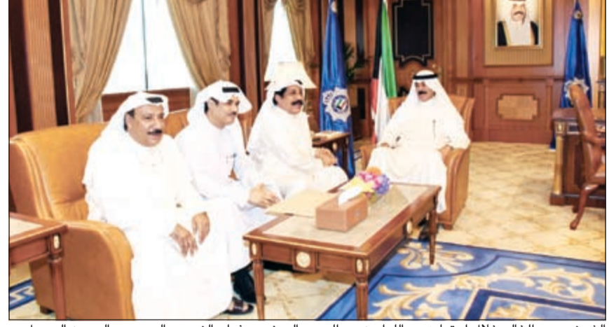
الشيخ محمد الخالد خلال اجتماعه مع اللواءين عبدالحميد العوضي وفرج الزعبي والعميد عبدالرحمن الصهيل

والتي من المقرر أن تنتهي يوم 22 الجاري. وقد استمع لشرح تفصيلي من اللواء العوضي والمختصين من مباحث السلاح وناقش معهم التقارير التحليلية المدعمة بالأرقام والبيانات التوضيحية وما أسفرت عنه إلى الآن من جمع الأسلحة والذخائر عن تسلم 3250 سلاحا متنوعا، وأكثر من 8 اطنان ذخيرة من مختلف أنواع الأسلحة، كما تم إصدار أكثر من 3800 ترخيص سلاح، وما زالت الجهود مستمرة ومتواصلة تمهيدا لبدء المرحلة الثانية والتي تتواكب مع بدء تطبيق القانون كذلك الخطط الميدانية للتطبيق العملي والتي تنطلق بتفتيش المركبات في الشوارع الرئيسية. وقد اختتم الاجتماع بتوجيه تعليماته لكل الجهات المعنية بحملة جمع السلاح بضرورة بذل المزيد من العمل والجهد في سبيل تحقيق الأهداف الوقائية للحملة الوطنية للتخلص من الأسلحة والذخائر غير المرخصة.