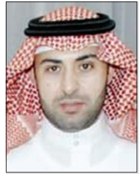
الشيخ عبدالله الملك

شخصاً ما جار ضبطه هو من زور له فيزا الوصول إلى جمهورية مصر العربية. ويحسب مصدر أمني، فإن السلطات المصرية أخبرت السلطات الكويتية بأن وافدا سوريا حضر إلى مصر وتبين أنه يحمل فيزا دخول مزورة وتمت إعادته على نفس