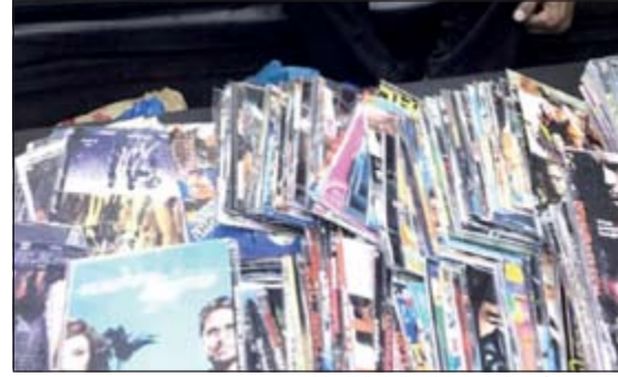
حملات الأمن العام شملت الباعة الجائلين