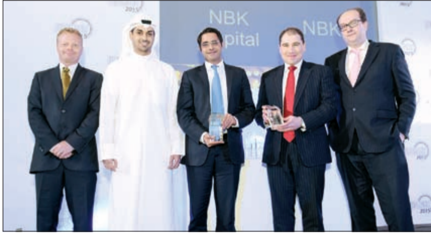
فريق عمل الشركة خلال تسلم الجائزة

الاستثمارية المصرفية. وتجدر الإشارة إلى أن شركة الوطني للاستثمار التي تعتبر من أهم البنوك الاستثمارية الرائدة على المستوى الإقليمي، بمكانتها التي تتوزع في كل من الكويت، دبي، اسطنبول، والقاهرة كانت قد تأسست في عام 2005 كشركة تابعة ومملوكة بالكامل من قبل بنك الكويت الوطني، أكبر بنك في الكويت والبنك الأعلى تصنيفاً في الشرق الأوسط، وتحرس شركة الوطني للاستثمار على تطوير وتقديم أفضل وارفى والخدمات والمنتجات الاستثمارية لعملائها والمستثمرين على حد سواء وقد نجحت الشركة بفضل فريق عملها الذي يضم أكثر من 170 من المصرفيين المحترفين والمتخصصين في تعزيز مكانتها بصورة مميزة وتقديم باقة متكاملة من الخدمات والحلول المالية، لاسيما في مجال إدارة الأصول، الاستثمارات البديلة، الخدمات المصرفية الاستثمارية والوساطة والبحوث.