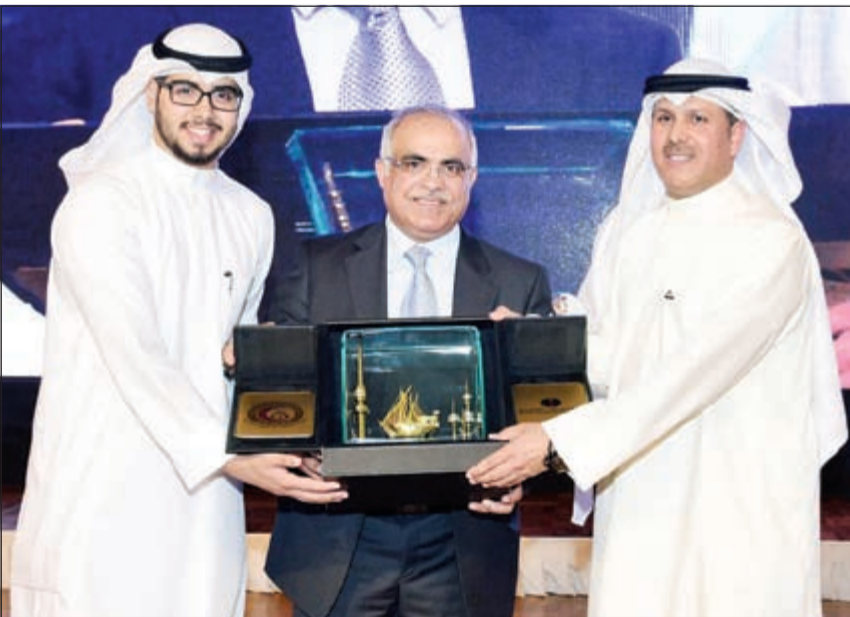
جانب من تكريم أحد الطلاب

رعت مؤسسة البترول الكويتية حفل تخرج رابطة طلبة الطب الكويتية جامعة الكويت، وذلك يوم الاثنين الموافق 15 يونيو 2015، في فندق ريجنسي. ومثل المؤسسة في الحفل العضو المنتدب للعلاقات وتقنية المعلومات، العضو المنتدب للتدريب بالوكالة علي العبيد الذي ألقى كلمة عبر فيها عن امتنانه لحضور حفل تخرج طلبة رابطة الطب الكويتية، مشيراً إلى الدور الحيوي والفعال للأطباء في المجتمع. وتطرق العبيد في كلمته إلى اهتمام مؤسسة البترول الكويتية بالعنصر البشري، الذي يعد العماد الرئيسي والثروة الحقيقية للبلاد، وأن هذا الاهتمام ينبع من الرؤية الاستراتيجية للدولة التي ترى أن الإنسان هو أساس عمليات التنمية والنمو. وفي نهاية كلمته، رجع العبيد لشكر أعضاء هيئة التدريس من الأستاذة الذين لم يبخلوا بعلمهم ومعرفتهم على الطلبة، والذين كانوا وما زالوا نبراساً تهتدي به الأجيال المتعاقبة.