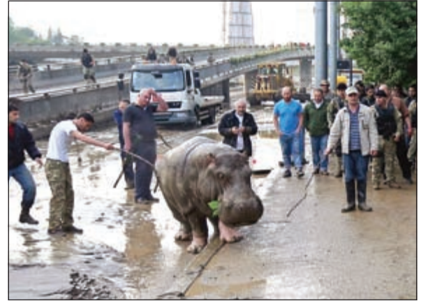
الإسماك بفرنس النهر

جورجيا - وكالات: سيطرت حالة من الذعر على عدد من سكان العاصمة الجورجية بعد هروب عشرات الحيوانات المفترسة من حديقة الحيوان بمدينة تبليسي أثناء الفيضان العنيف الذي شهدته ليل أمس السبت، حسمما جاء في صحيفة «ديلي ميل».