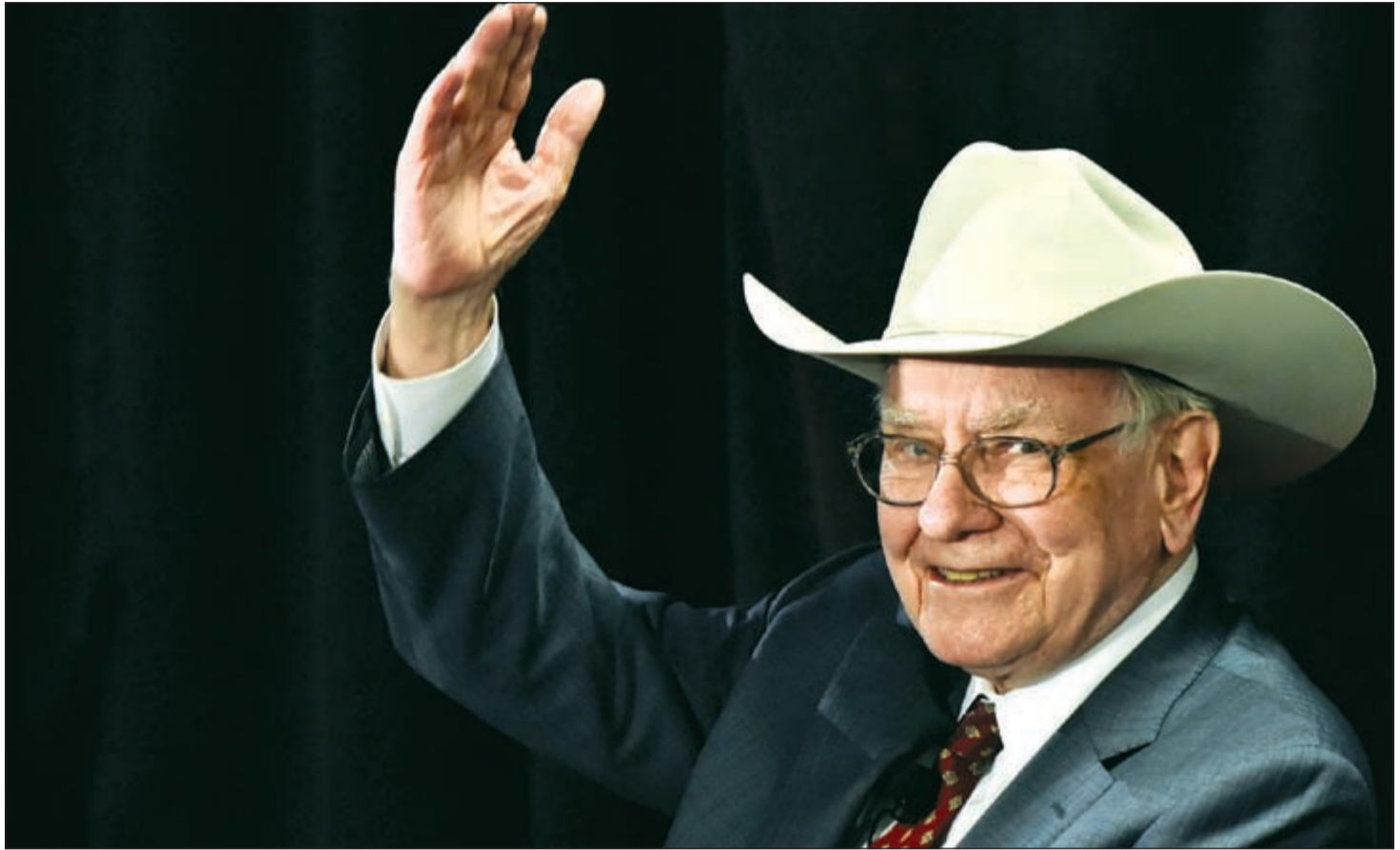
ماذا سيحدث بعد رحيل ملهم المستثمرين وارن بافيت في أكبر شركة قابضة في العالم؟

أصدر المركز المالي الكويتي (المركز) تقريرا حول الاستثمار في شركة بيركشير هاتاواي العالمية التابعة لرجل الأعمال الأميركي الملياردير وارن بافيت، حيث تناول التقرير الفلسفة الاستثمارية المتبعة لتحقيق النمو المستدام للشركة ومدى شعبيتها مقارنة بشركة «آبل».