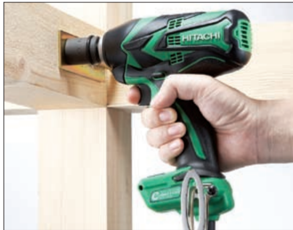
إحدى معدات «هيتاشي»

المبيعات برايمش شيليا. والجدير بالذكر أن شركة