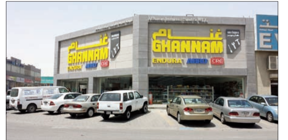
فرع الغانم للمعدات الكهربائية