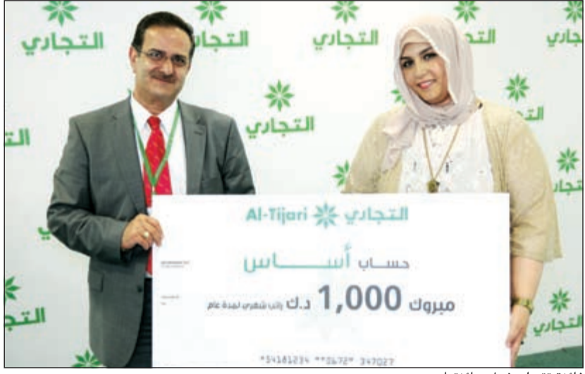
فائزة تسلم شيك جائزتها

مستمرة حتى شهر يونيو الجاري وتوفر للعملاء فرصة لاختبار جائزة من بين ثلاث جوائز هي عبارة عن راتب لمدة ستة بقيمة 1,000 شهريا أو سيارة لكزس 250 IS موديل 2015 أو رحلة على متن طائرة كاسا إلى دبي وإقامة فاخرة بفندق أتلانتس. كما أن عملاء باقة «أساس» الجديدة والمخصصة للموظفين الذين تتراوح أعمارهم ما بين 21 و30 سنة والذين يقومون بتحويل رواتبهم البالغة ما بين 750 دينارا كويتيا إلى 1,999 دينار إلى البنك التجاري سيستفيدون من مميزات عديدة من بينها اختيار بطاقة السحب الآلي من بين تصميمين متميزين والحصول مجانا على بطاقة ماستركارد تتناوبم الإئتمانية الجديدة والاستفادة من خدمة المساعد الشخصي في الكويت ودخول مجموعة من قاعات رجال الأعمال في مطارات الشرق الأوسط وكذلك الحصول على بطاقة فيزا مسقة الدفع مجانا والاستمتاع بالعديد من الخصومات في العديد من المطاعم والمتاجر ومحلات التجزئة.