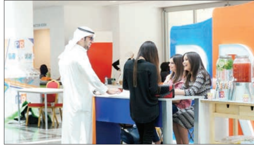
جانب من المهرجان

الاعتماد أعلى إنجاز لجميع كليات العلوم الإدارية في العام. وأعلنت كلية العلوم والتكنولوجيا اتفاقية مع جامعة ماساشوسيتس لويل (يوماس لويل) في الولايات المتحدة الأمريكية والتي من شأنها أن توفر 5 برامج جديدة في الماجستير المزدوج وبرامج البكالوريوس في الهندسة، وسيتم الإعلان عن المزيد من البرامج الجامعية والدراسات العليا المستقبل في الهندسة في المستقبل القريب.