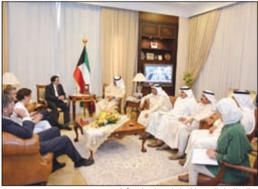
خالد الجارالله خلال لقائه ولغفانغ أماديوس

اجتمع وكيل وزارة الخارجية خالد الجارالله أمس مع الوكيل المساعد للشؤون السياسية ومدير إدارة الشرق الأوسط وشمال أفريقيا في وزارة خارجية الاتحاد السويسري ولغفانغ أماديوس الذي يقوم بزيارة للبلاد والوفد المرافق له. وتم خلال اللقاء بحث عدد من أوجه العلاقات الثنائية بين البلدين إضافة إلى تطورات الأوضاع على الساحتين الإقليمية والدولية.