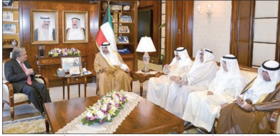
الشيخ صباح الخالد مستقبلا أنطونيو غوتيريس بحضور خالد الجارالله ومسؤولي الخارجية

شعوب العالم ولاسيما معاناة الشعب السوري الشقيق منذ اندلاع الأزمة في سورية. وأتني على حرص الكويت من خلال توجيهات صاحب السمو الأمير الشيخ صباح الأحمد على الوفاء بجميع الالتزامات المقطوعة في المؤتمرات الدولية الثلاثة للمانحين لدعم الوضع الإنساني في سورية والتي استضافتها الكويت خلال السنوات الثلاث الماضية حيث أسهمت في تخفيف المعاناة الإنسانية للشعب السوري الشقيق. حضر الاجتماع وكيل وزارة الخارجية خالد الجارالله ومدير إدارة مكتب النائب الأول لرئيس مجلس الوزراء ووزير الخارجية السفير الشيخ د. أحمد ناصر المحمد ومدير إدارة المنظمات الدولية جاسم المباركي وعدد من مسؤولي وزارة الخارجية.