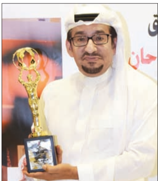
الفنان السعودي عبدالله السدحان متسلماً درعاً تكريمياً من 'الأنباء'

عبدالله السدحان: تكريم 'الأنباء' لي نقطة مضيئة في تاريخي 26 27