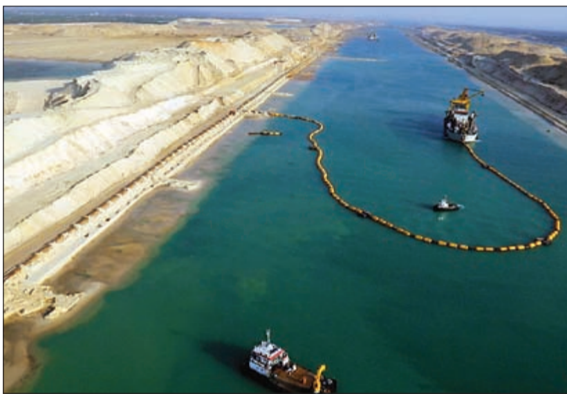
جانب من أعمال الحفر النهائية في قناة السويس الجديدة

وزيرة السياحة والبلديات للوفد الصحافي الكويتي: تجربة الكويت في مجال الاستثمار السياحي ناجحة وأدعو الشركات الكويتية إلى التوجه لكرديستان