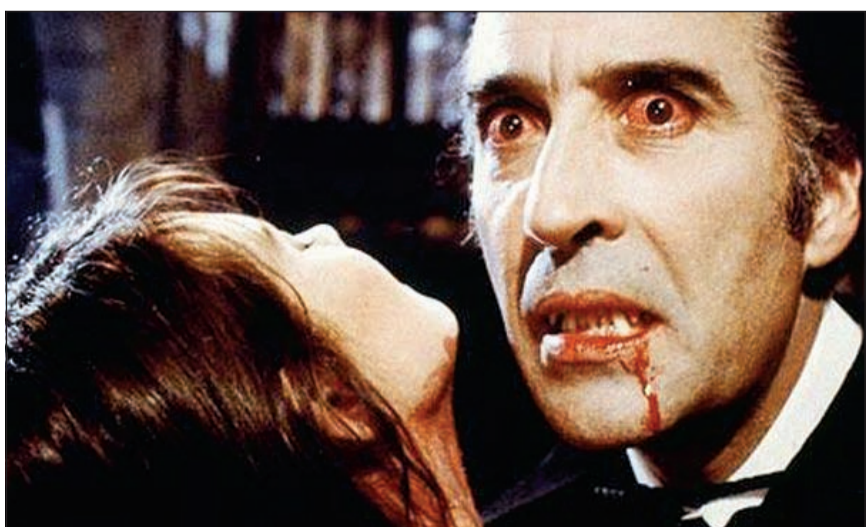
مشهد من أفلامه