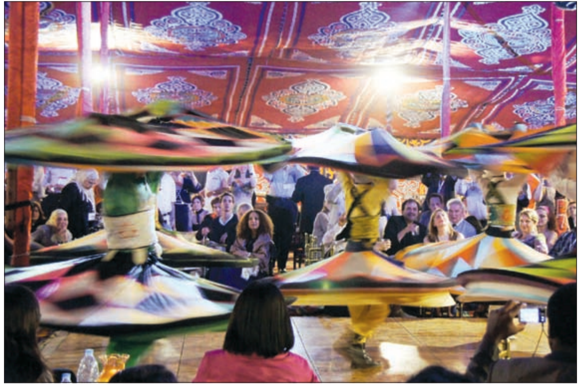
سهرات الخيم الرمضانية في القاهرة تجذب السياح من الكويت وترفع أسعار التذاكر