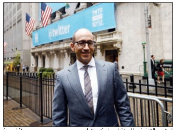
الرئيس التنفيذي المستقيل ديك كوستولو

سان فرانسيسكو - رويترز: بينما أسعد رحيل الرئيس التنفيذي لتويتر ديك كوستولو حملة نهجا مختلفا وأغرقوا الموقع برسائل الشكر والدعم للرجل الذي أدار موقع التدوين المصغر قرابة 5 أعوام. وبعد وقت قليل من إعلان تويتير استقالة كوستولو بدءاً من أول يوليو القادم أنهالت الرسائل التي لا تزيد على 140 حرفاً بإشادات من الموظفين والمؤيدين له وكانت الكلمة المشتركة في كثير من الرسائل «شكراً ديك». فيما كتب مصمم الموقع بول ستاماتيو «سأفتقد هذا الرجل». وكانت ردة فعل «هول