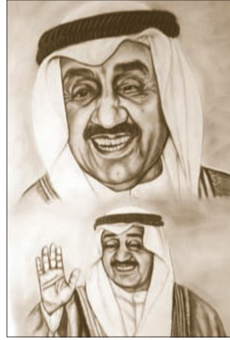
رسم للراحل الكبير جاسم الخرافي