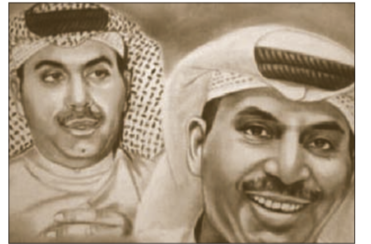
النجمة طارق العلي

جاسم الخرافي وعدد من الشخصيات المعروفة في الخليج والذين أشادوا بلوحاته. وذكر الرسام معتصم أنه يعشق رسم الأطفال بجميع أحوالهم لأنهم أحباب الله وأنه سيشارك في معرض رمضان من تنظيم جهة خاصة بلوحات جديدة شاكرا الجهة المنظمة على دعوته للمشاركة في هذا المعرض.