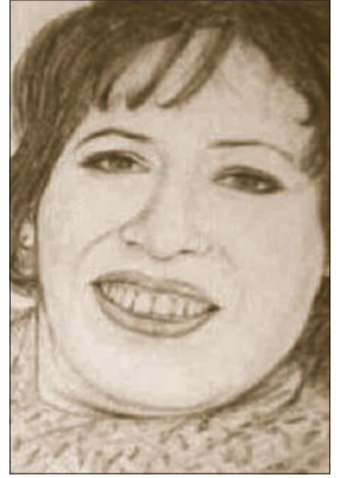
الفنانة القديرة حياة الفهد