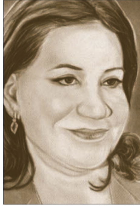
الفنانة القديرة سعاد عبدالله